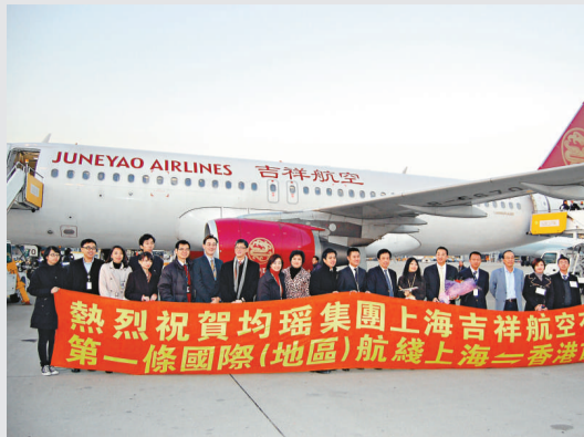
▲吉祥航空全新空巴A320昨日抵達香港國際機場，機管局代表到現場接機，並於機坪舉行新航線首航慶祝儀式