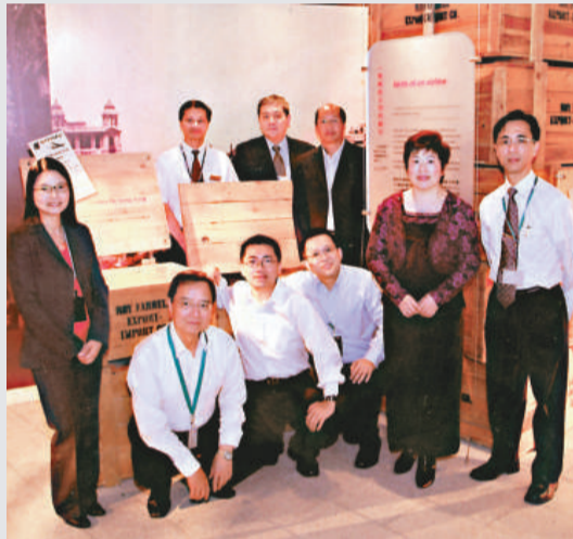
▲國泰電子貨運團隊在全面電子化前與舊式木質箱合照留念

為慶祝開通香港航線，吉祥航空特推出低至單程600港元以及往返程1000港元的優惠。開航後的1個月內，旅客可額外多獲10公斤免費行李額。以此計算，經濟艙的免費行李額可達30公斤、商務艙可達40公斤，常旅客會員還將獲贈額外積分獎勵。