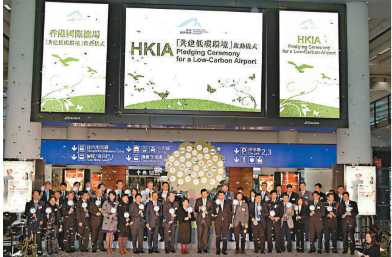
▲香港機管局在機場客運大樓為「共建低碳環境」活動舉行啓動儀式

波羅的海乾散貨綜合運費指數(BDI)周五已經連跌9天，跌至1999點，近1個月第三次靠近2000點後，終於跌破該關口，是自8月初以來首次。其中，巴拿馬型船日租金是自09年4月以來最低位，主要由於澳洲東部裝貨港受暴風影響。路透社綜合11位船舶經紀和分析师意見，預期BDI在明年首季只會輕微回升。另外，英國會計師事務所Moore Stephens統計結果顯示，海運業對市場前景信心回落。BDI此前兩次在靠近2000關口都及時反彈，近1個月的兩次跌勢最低點只為2096點，但該指數今次顯著回落，即使此前升勢較為平穩的超靈便型船指數亦反覆下跌，而且在海岬型船租金回升乏力的情況下，巴拿馬型船日租金是下插至09年4月以來最低位。儘管現水平與7月15日的1700點最低位仍有距離，但該指數正有越走越弱的趨勢。三大船型指數中，海岬型船運費指數(BCI)報2723點，再升0.5%，現貨日租金為25003美元。巴拿馬型船運費指數(BPI)報2037點，大跌5.1%，現貨日租金為16281美元。超靈便型船運