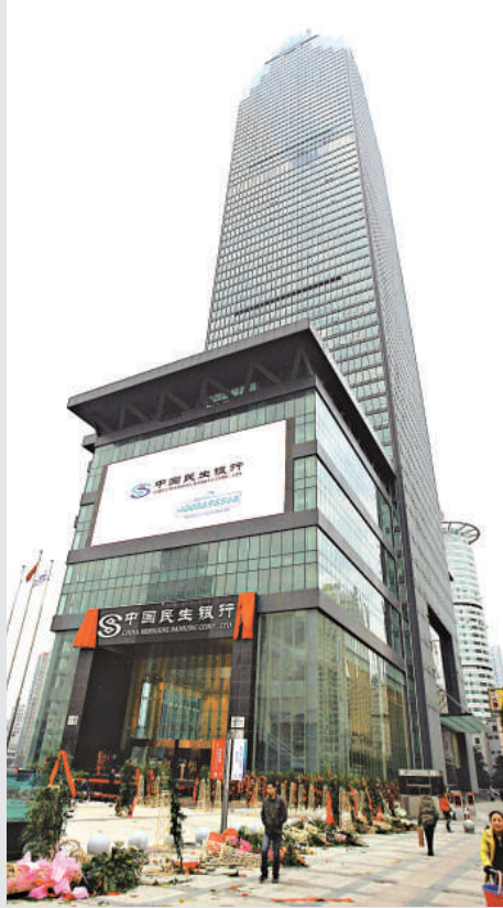
◀ 12 月 18 日，總高度為 325 米、共 68 層的武漢中國民生銀行大廈正式投入使用。這座建造時間長達 12 年之久的高樓，是武漢市目前建成的最高建築，也是目前華中地區「第一高樓」