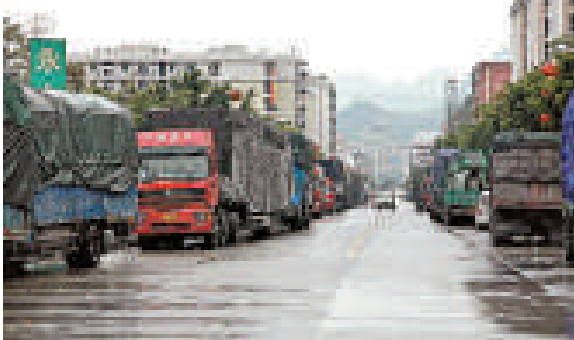
▲ 京珠重開，湖南以北滯留的大量貨車蜂擁而下，車流攀升一倍以上 網絡圖片

廣東省交警部門表示，儘管目前粵北韶關氣溫已回升至 5 度左右，抗冰雪災害三級響應預案也已解除，但京珠高速在夜晚的最低溫度仍維持在零度左右，並伴有霧，加上南下北上的車流龐大，未來幾天的交通疏導挑戰依然巨大。