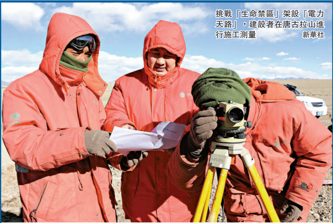
挑戰「生命禁區」架設「電力天路」，建設者在唐古拉山進行施工測量