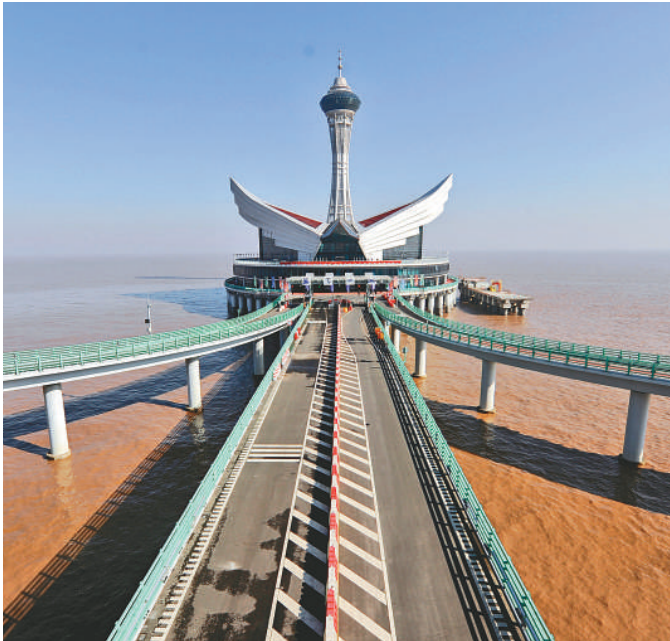
▲ 正式落成的「海天一洲」觀光塔和觀光平台

試運營期間，「海天一洲」瞬時最大客流量可達 3000 人。為加強景區旅遊客運秩序，現禁止各類貨車、大中型客車駛入，並實行遊客限額管理，大橋沿線電子顯示屏將為旅客及時提供與「海天一洲」有關的旅遊交通流量變化信息。