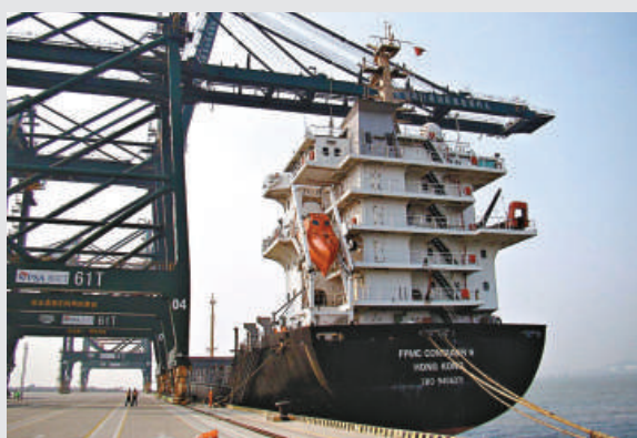
▲虎門港已於3月底開通首條對台直航班輪航線

春秋是內地首家廉價航空公司，在9月底時宣布開通香港至上海浦東機場航線，目前已鎖定期香港出發至上海和北京兩大熱門航線的客源。該公司在今年11月15日開始，已於每周一和周四上午10時推出2萬張9元起機票促銷活動，春秋稱之為「秒殺活動」，至今已至第十期。