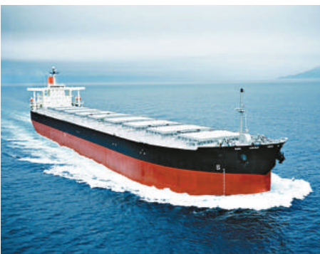
▲海岬型船租金難望出現重大起色

北京船舶經紀消息稱，船東寄望中國煉鋼廠會趕在農曆新年來臨前的明年1月，生產更多鋼材，集中推高鐵礦石海運需求。他認為，相對安排船舶開置，船東會偏於向租家提供折扣，以更低價短期租出船舶，等待明年初租金回升時再租出，亦即散貨船租金可能短期內仍會受壓。