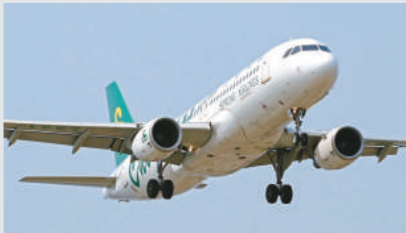
▲春秋貫徹廉航營運方式，再以超低價機票搶客

今年1至11月，機場的累計客運量共4650萬人次，貨運量為380萬公噸，分別按年增長10.7%及24.8%。