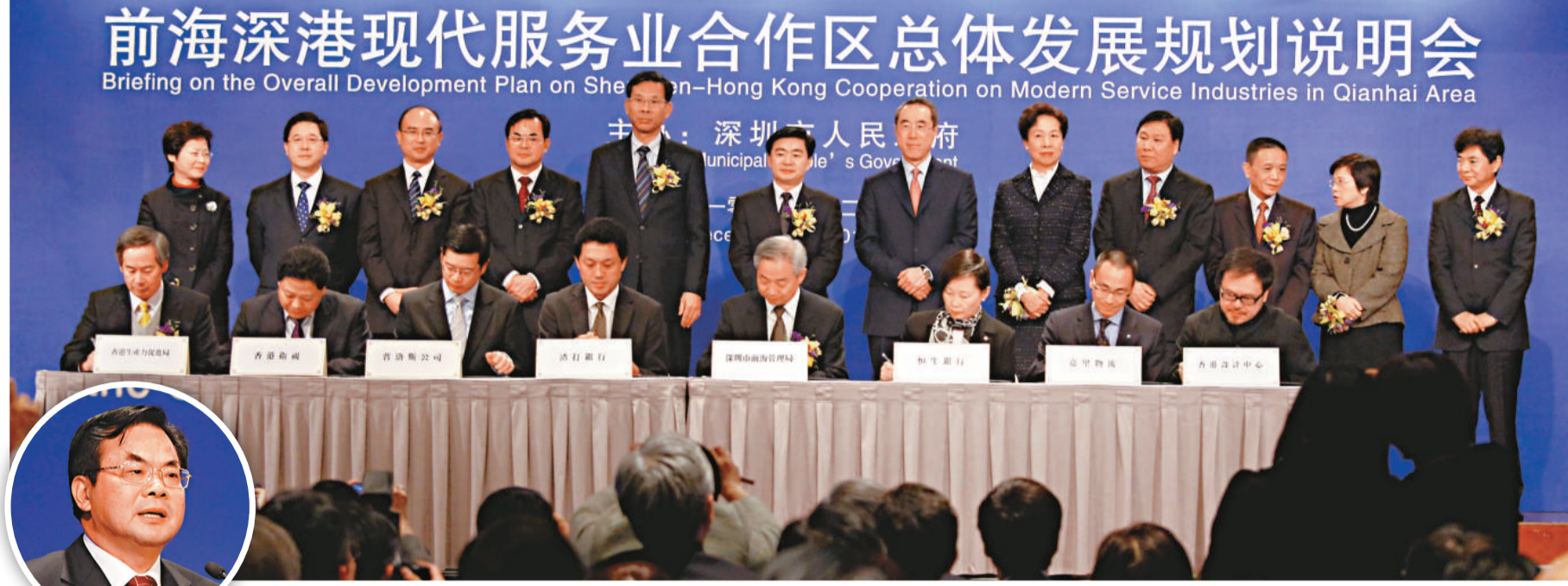
▲前海深港現代服務業合作區總體發展規劃說明會，一眾嘉賓見證前海管理局與香港企業簽訂合作意向書

客運燃油附加費是在航油價格出現波動時，幫助航空公司收回部分的額外經營成本。作為香港的民航當局，民航處按照有關的雙邊民用航空運輸協定，審批航空公司的燃油附加費申請。