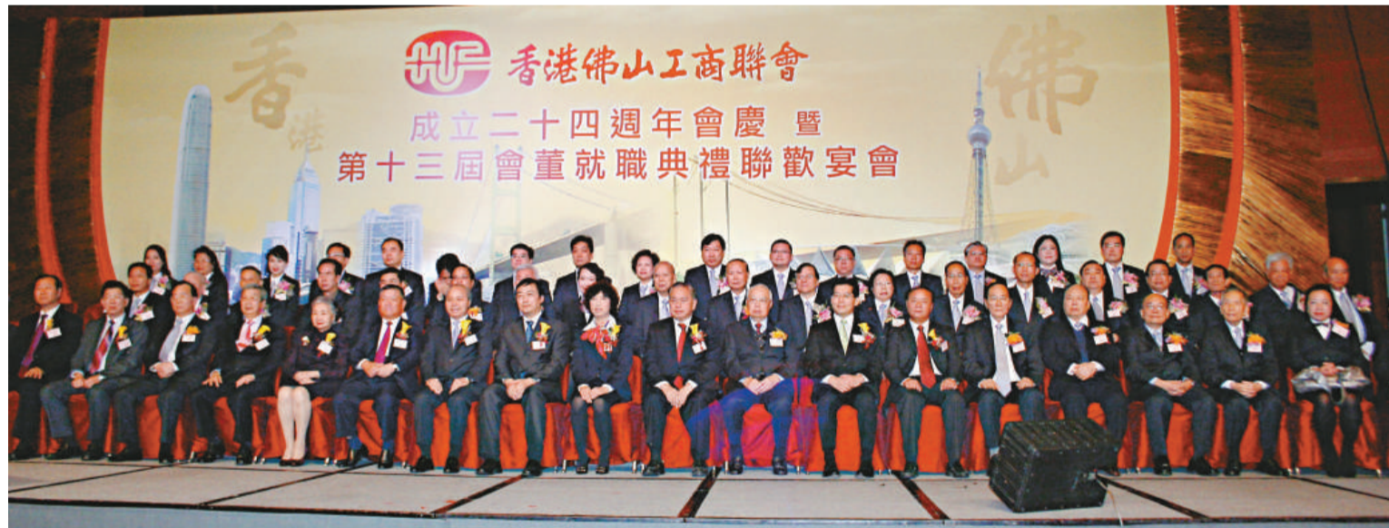
▲主席台上賓主合影

【本報訊】記者黃聞報道：香港佛山工商聯會成立24周年暨第十三屆會董就職禮日前在灣仔會展館隆重舉行。應邀前來主禮的嘉賓包括中聯辦協理鄧永祥、佛山市政協主席蔡河義、廣東省委統戰部副部長蔣樂儀、香港基本法委員會副主任梁愛詩、全國政協常委余國春、香港廣東社團總會主席王國強、香港商務及經濟發展局副局長蘇錦樑、中聯辦港島工作部副部長陳熾彬、佛山市委副書記楊曉光、市政協副主席、市委統戰部部長黃炳等。來自家鄉的有關領導、本港各界友好及會員鄉親近千人歡聚一堂，同慶賀。在全場人士的見證下，會長鄧佑材率新一屆中全體會董正式就職。鄧佑材致詞時首先感謝會員的信任，獲選聯會會長一職。他指，創會24年來，在大家的關懷和支持下，該會會務不斷壯大和發展，