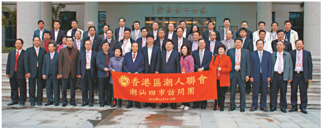
▲訪問團到訪普寧市，於莊世平博物館前留影