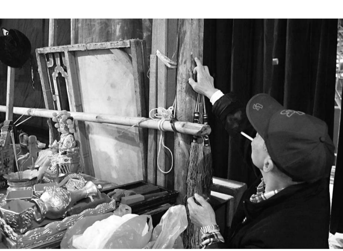
丑生黃君林手蘸紅墨在竹枝寫上「大吉」二字

為神功戲而搭建的戲台，一般對着廟宇或臨時神棚，讓神明觀戲。若進行打醮或舉行盂蘭勝會，傳統觀念認為場地會充斥幽魂，所以更要敬奉鬼神，以免演員演出失準，甚或失足墮於台下。