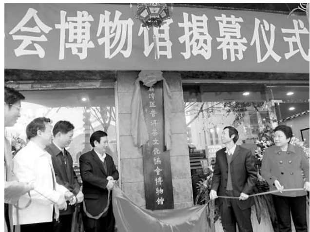
普洱茶文化的演變與發展