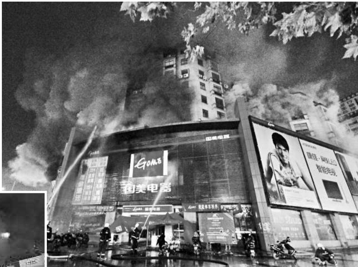
▲12月24日晚，起火的國美電器商場濃煙滾滾