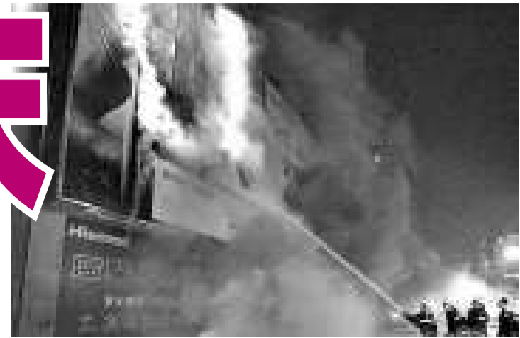
▲消防員全力撲救大火