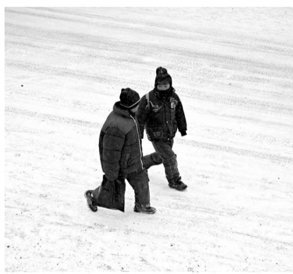
▲寧夏固原鄉村，小學生放學後冒雪而行

氣象專家認為，此次雨雪過程將於26日結束。由於後期南方大部的氣溫將迅速回升，不會造成持續的雨雪冰凍天氣。