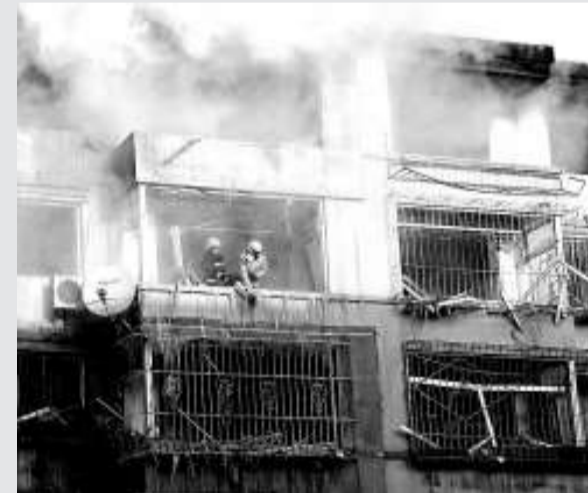
▲火勢受控後，民居樓仍然冒出濃煙

胡偉，男，漢族，1962年1月生，浙江德清人，1982年8月參加工作，中國社會科學院研究生院社會學系應用社會學專業畢業，在職研究生學位，法學博士。曾任共青團中央宣傳部副部長、共青團中央統戰部部長、全國青聯秘書長（2000年12月增補為共青團中央常委）、共青團中央書記處書記、全國青聯常務副主席、新疆自治區副主席。