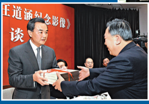
▲24日，《無限的思念——汪道涵紀念影像》出版座談會在上海舉行。該書收入汪道涵各個時期的珍貴圖片350餘幅，從不同側面再現了他為中國革命、建設和改革事業奮鬥的70多個春秋。圖為中台辦主任王毅向上海圖書館贈《汪道涵紀念影像》