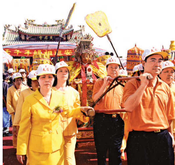
▲2002年5月8日，金門大旱，湄洲媽祖金身起駕巡安金門，次日晚金門下雨

兩岸，媽祖信仰是割捨不斷的親情紐帶。因此，兩岸媽祖文化交流走在了「小三通」之前，彼時的兩岸關係是「明不通暗通、官不通民通、人不通神通」。