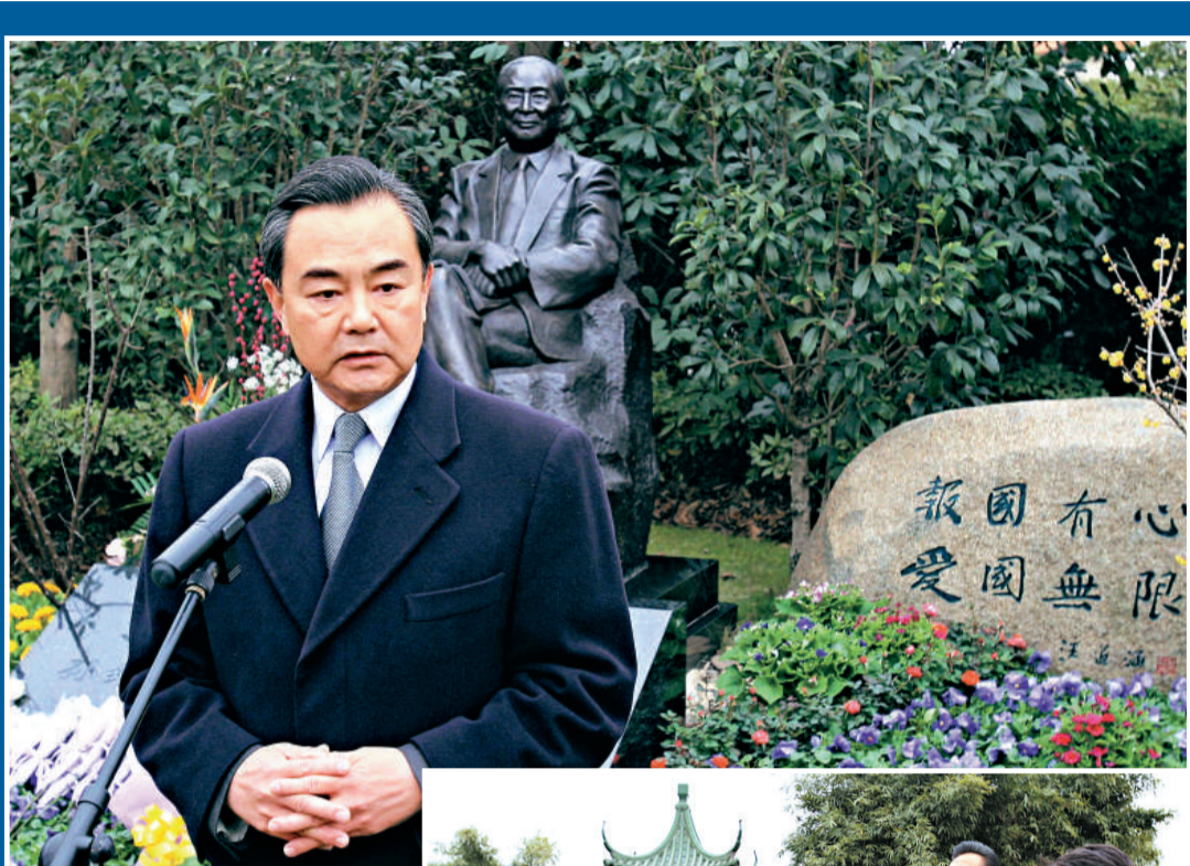
▲王毅24日在福壽園汪道涵紀念像前現場講話表示，兩岸交流合作取得大交流、大合作的成就，與汪老當年付出的努力分不開，他的在天之靈，也會感到欣慰

祭奠儀式結束後，王毅等一行入選赴福壽園人文紀念博物館參觀，這裡收藏展出汪老生前使用過的辦公桌、椅子、檯燈、筆墨紙硯等生活辦公用品。