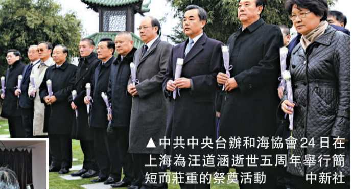
▲中共中央台辦和海協會24日在上海為汪道涵逝世五周年舉行簡短而莊重的祭奠活動