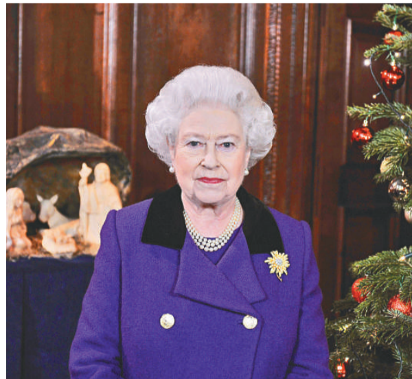
▲英女王每年都會於12月25日發表聖誕文告