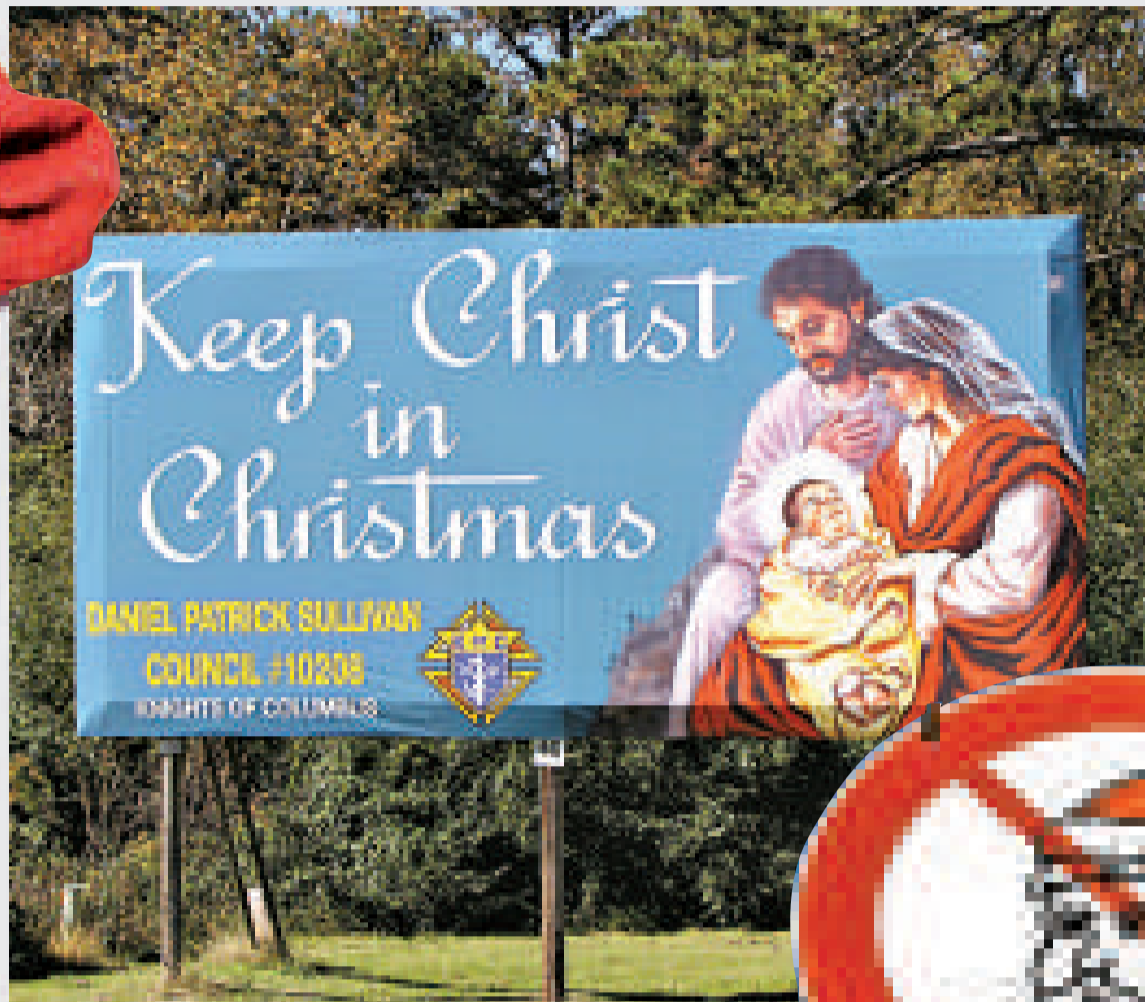
▲廣告呼籲美國人重拾基督教的聖誕節 互聯網 ▲美國重視聖誕節，但也有人「反聖誕」 互聯網

團隊決定繪製出世界各地慶祝聖誕節的方式，以食物、舞蹈、建築等主題突顯節慶氛圍，並由後製團隊將十七幅圖像整合成互動式的介面。