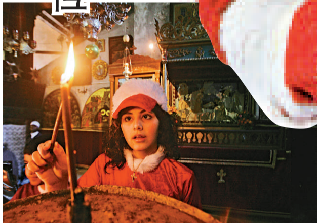
▲一名女孩24日在耶穌出生地伯利恆燃點燭光禱告

在耶穌的出生地巴勒斯坦伯利恆，周五陽光普照，大批信眾前來朝聖，其中包括一些中東國家的基督徒。國內的宗教仇恨，使他們許多都不敢在本國慶祝這個普天同慶的節日。