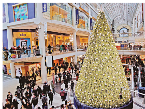
▲加拿大多倫多一家商場人潮如湧