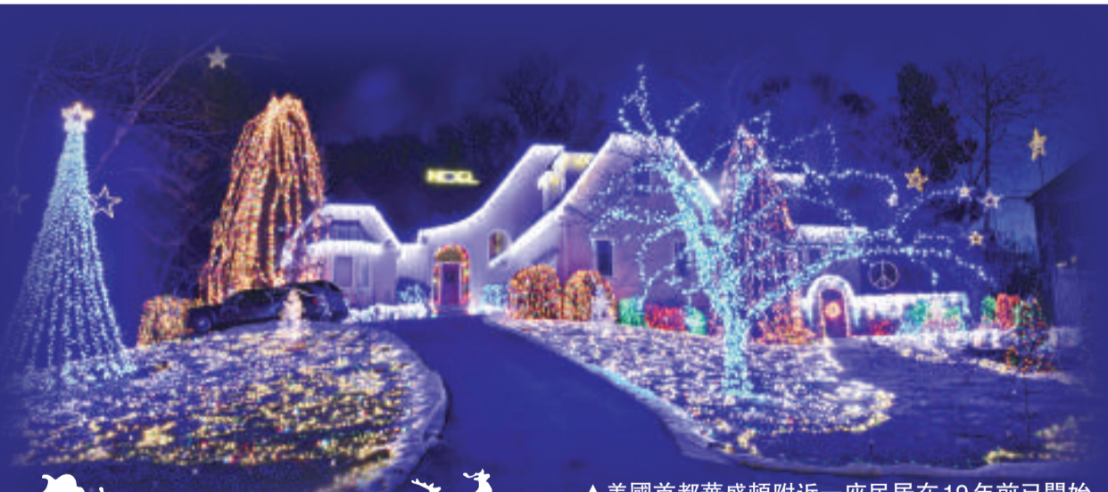
▲美國首都華盛頓附近一座民居在19年前已開始布置聖誕燈飾，然後每年都會添加新燈飾。今天，這間屋已經布置了26萬盞燈，並成為了當地一個旅遊名勝

目前，仍有許多人為聖誕節而吵吵嚷嚷，譬如公眾地方聖誕燈飾的費用應用否用公帑支付，甚至「聖誕」這詞語應否在學校和在由政府舉辦的活動中使用。美國政壇人物不時會趁着聖誕節，叨叨絮絮地強調政教分離是多麼重要。另外，有學者激烈討論現代的聖誕節慶祝的源頭是否帶有異教徒因素，而基督教「原教旨主義者」則批評那些鼓吹禁止在聖誕節慶祝活動中提及耶穌的人。每過一年，荒謬的爭論都有增無減。久而久之，美國人因為怕犯下「政治錯誤」而索性將聖誕「去聖誕化」。諷刺的是，沒有聖誕節的其餘11個月份，從來沒有人繼續討論聖誕的「重大問題」，只等12月再來打口水戰。而這場戰爭將難以有結束的一年。有人認為，聖誕節的信息之中，最重要的就是和平，因此這麼多人在聖誕節不管其他重要問題，偏要為聖誕節而大發議論是十分荒謬的行為。