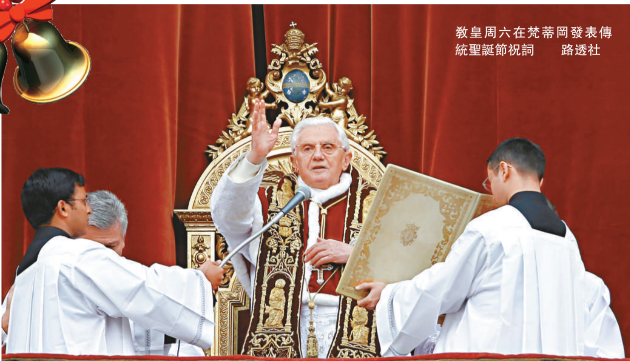
教皇周六在梵蒂岡發表傳統聖誕節祝詞