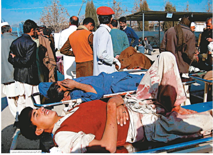
▲在巴基斯坦自殺式爆炸中受傷的民眾在醫院外接受治療

哨所 24 日遭武裝分子襲擊，至少造成 11 名軍人喪生，另外還有 9 人受傷。據悉，共有 150 多名武裝分子參與了當天的連環襲擊活動。巴軍方官員透露，整個交火過程持續了數小時之久，共有 40 名武裝分子被打死。 這是自從巴基斯坦軍隊向盤踞該國西北部地區的極端勢力發起清剿活動後，當地武裝分子採取的「最大規模報復行動」。此前，美國不斷指責巴基斯坦對境內的武裝分子「聽之任之」，結果造成這些人在巴境內安營扎寨，並能隨意出入阿富汗南部地區開展各類襲擊活動。