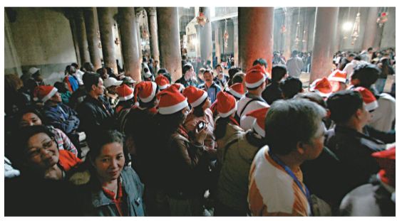
▲大批遊客到伯利恆慶祝聖誕

聖伯多祿廣場架設巨型電視屏幕直播儀式，由於羅馬兩間外國使館日前發生郵包炸彈，聖伯多祿廣場加強保安，所有進入的信眾接受檢查，四周泊滿警車。