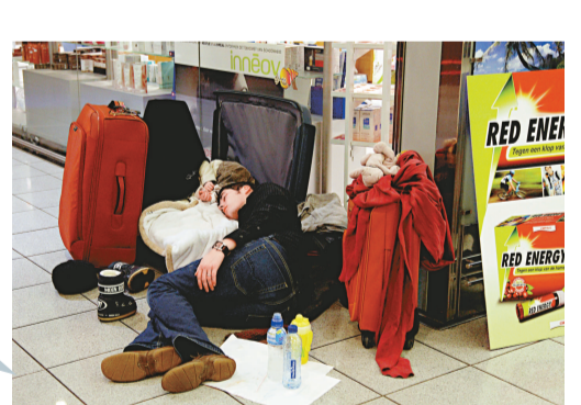
▲一名旅客在布魯塞爾機場睡覺