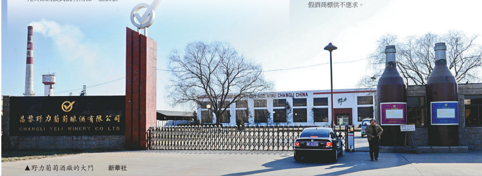
野力葡萄酒廠的大門

昌黎縣一位官員對記者說，媒體對昌黎紅酒曝光，對昌黎紅酒產業的打擊可能是毀滅性的，如同三鹿事件對中國奶業的打擊。不過這位官員坦稱，政府會汲取教訓，清除害群之馬，重振昌黎紅酒威名。據悉，政府已對涉嫌造假的企業一律實施關停，調查後處理，並召回涉造假企業所生產的全部產品。