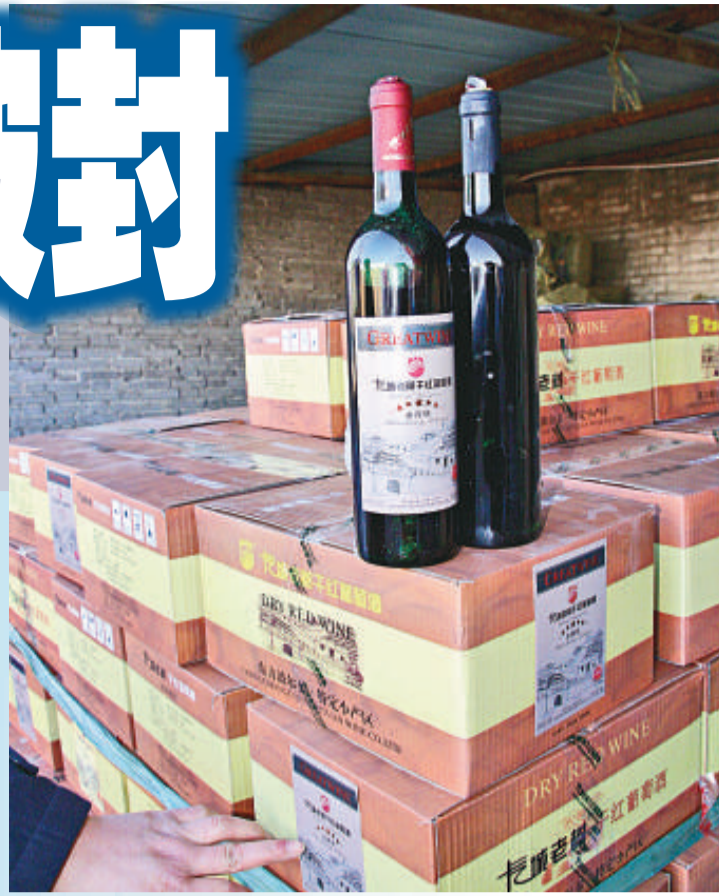
被查封的「長城老樹」乾紅葡萄酒