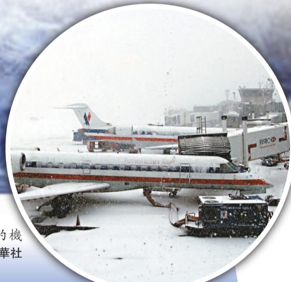
▶飛機停在紐約機場停機坪上

聯合國26日晚發布消息說，由於美國東部地區遭遇暴風雪襲擊，紐約聯合國總部將於27日關閉一天。 記者26日晚撥打聯合國員工緊急事務熱線，電話中的語音留言說「由於惡劣天氣，紐約聯合國總部將於12月27日關閉一天，當天所有在聯合國總部舉行的會議將被取消」。隨後，聯合國通過網絡發布了同樣的消息，並表示27日的遊客參觀項目也將暫停。