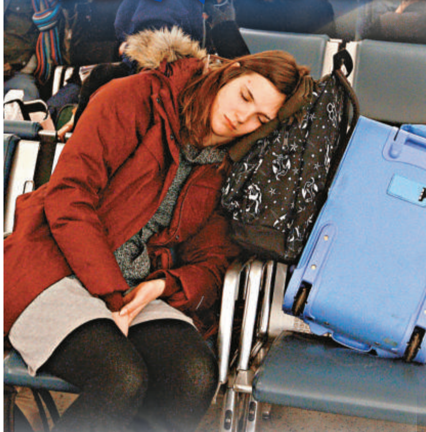
▲旅客因為列車被取消而行程受阻