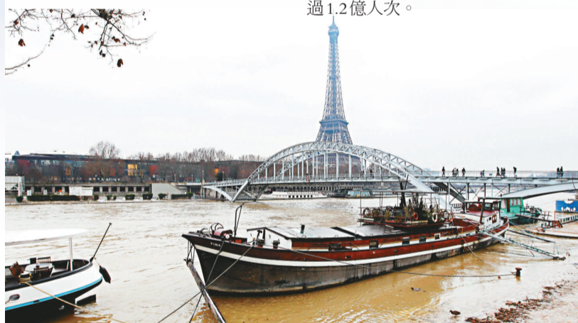
▲因為河水暴漲，塞納河上的遊船暫停營業

巴黎相關部門已經發出了預警，預計26日晚河水將上漲到4.5米，並在幾個小時內上漲1米左右。如果達到了預計的漲幅，塞納河上較小的船隻也將被迫暫時停運。這樣的情況至少在近4年來難得一見。塞納河河水最大漲幅紀錄為1910年的8.62米。 出於安全考慮，巴黎有關部門已將塞納河部分河堤和行車通道臨時關閉，塞納河邊一些餐館也暫停營業。 創始於1949年的塞納河遊船項目是排在艾菲爾鐵塔、羅浮宮以及蓬皮杜文化中心之後的第四大旅遊項目，已累計接待遊客超過1.2億人次。