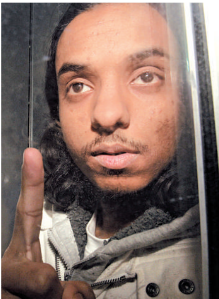
▲一名恐嫌在離開法院後從警車中望出

了幾個月的監視，包括跟蹤他們對倫敦幾個地標的探究。9名恐怖嫌犯年齡19至28歲，有的在英國出生，有的跟隨父母自小移民到英國，全部在英國接受教育，大部分是穆斯林，其中好幾名是孟加拉裔人。 倫敦國際事務研究所的國際安全問題專家保羅·科