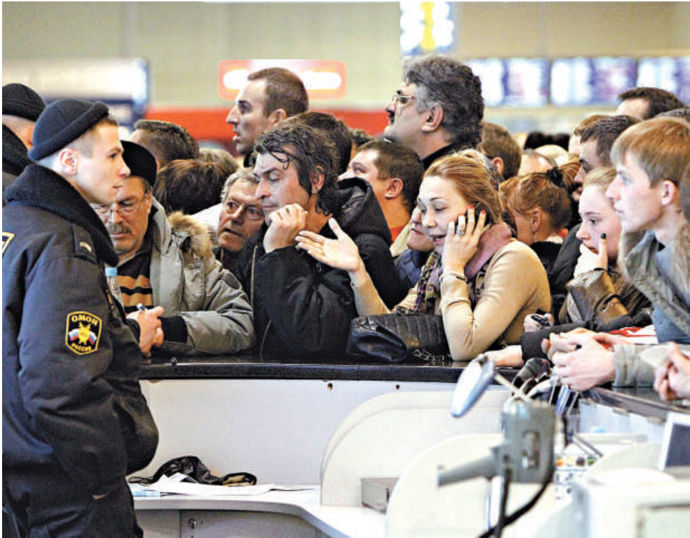
◀警察28日在莫斯科機場試圖平息滯留旅客的情緒

很多人即使通過了安全檢查也要等待超過24小時。國際文傳電訊社報道，機場職員多次把旅客由一個登機開口帶到另一個登機開口，在一次又一次造成延誤後，其中一個開口發生了打鬥事件。