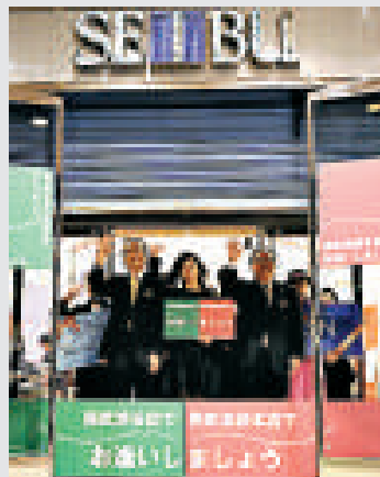
▲東京西武百貨有樂町店員站在正門口宣布結業

京最核心的商業地帶銀座一有樂町，它的倒閉被稱為有樂町一張面孔的消失。1984年，西武百貨開店時正逢日本經濟蓬勃之時，它作為流行文化的發源地而被人們所熟知。即使在上世紀80年代末泡沫經濟中瀕臨破產，也在90年代中期推出針對職場女性的高級時尚品牌而再度崛起，鼎盛時期1992年的銷售額曾高達275億日圓，但是2009年的銷售額僅為138億日圓。