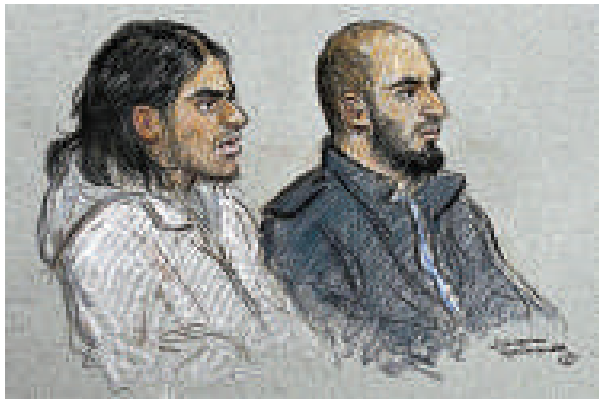
▲九名恐嫌27日在倫敦西敏寺地方法庭出庭時的畫像