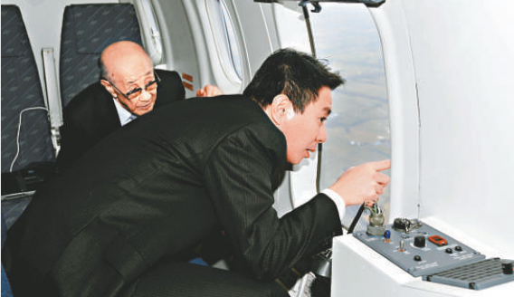
▲日本外相原誠司（右）12月4日在空中視察南千島群島（日方稱北方四島） 新華社

【本報訊】據香港中通社28日電：日本每日放送（MBS）新聞網28日稱，俄羅斯薩哈林州州長27日透露，包括俄國防部部長、俄聯邦運輸部部長以及俄聯邦地區發展部部長在內的數名俄政府高官，將會於2011年初再次訪問南千島群島（日稱「北方四島」）部分地區，並稱此次訪問為「新年首訪」。報道稱，此次訪問的目的是為了全面了解當地的通貨膨脹等經濟發展狀況，以便於制定相應發展對策。