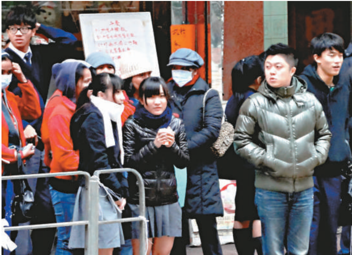
▲氣溫驟降，易誘發哮喘。本港每年平均有超過二萬名病人因哮喘惡化求醫

崔俊明稱，扭動式氣管舒張劑三分鐘起效，可維持十二小時，一般情況下，病人只需「早晚各吸一口」，每日連預防及急救，最多吸入八下，若超過即表示病情失控，需要入院。他還說，扭動吸劑每日醫療費只需六元九角，比傳統平宜近三成。他建議十八歲以上、病情輕微病人，可考慮改用扭動式氣管舒張劑，嚴重病人仍需用傳統治療。