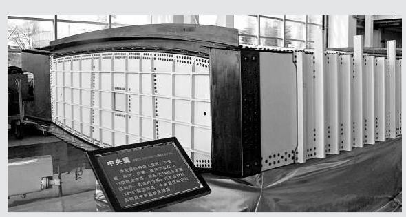
▲C919大型客機中央翼、襟翼部段樣件研製完畢正式下線，這是交付的C919大客機中央翼部段樣件。

交通運輸部部長李盛霖28日在北京召開的全國交通運輸工作會議上指出，今後一個較長時期有四個「沒有變」：一是整個國家仍處在重要戰略機遇期沒有變；二是交通運輸作為國民經濟基礎性和先導性產業、服務性行業的戰略地位沒有變；三是各級政府對發展交通運輸的重視支持和國人持續增長的交通運輸需求沒有變；四是中央優先發展交通運輸的方針政策沒有變。為此，交通運輸部提出了「十二五」交通運輸發展的總體要求。為落實「十二五」時期交通運輸發展總體要求，未來5年將穩步推進基礎設施建設。公路方面以國家高速公路網建設為龍頭，加強省際「斷頭路」建設，到2015年基本建成國家高速公路網。