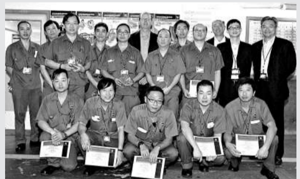
▲獲頒發逾15年年資安全駕駛榮譽獎的UPS香港外勤派遞員

山口還強調，隨着發展出這種新鋼材和應用標準指引，令造船業和船東有機會改善油輪安全，同時為行業降低成本。