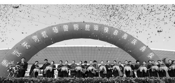
▲武漢天河機場國際航站樓正式啓用。

隨着中部地區經濟大發展，武漢天河機場近年來國際和地區客貨運輸增長迅速。今年預計全年國際和地區客流將突破35萬人次，同比增長85%。2011年，武漢國際和地區航空客運有望達到40萬人次。目前武漢天河機場的國際與地區通航點已達10個，已有5家國際和地區航空公司在漢運營。