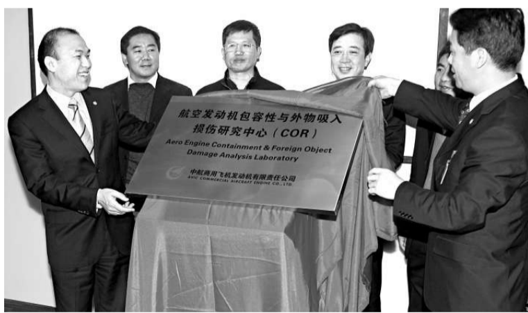
▲首個商用航空發動機基礎技術研究中心掛牌運行，嘉賓共同為航空發動機包容性與外物吸入損傷研究中心揭牌。新華社

而根據計劃，至2012年，中航工業商發將在部分關鍵技術領域完成實質性能力建設，陸續建立先進燃燒技術COR、結構完整性COR、低噪聲COR等專業COR平台，成為商發項目推進可靠的技術保障；至2016年，可在多個技術領域建立十餘個COR平台，從而基本滿足型號研製的工程需求。