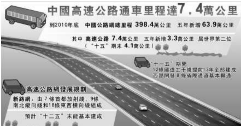
中國高速公路通車里程達7.4萬公里