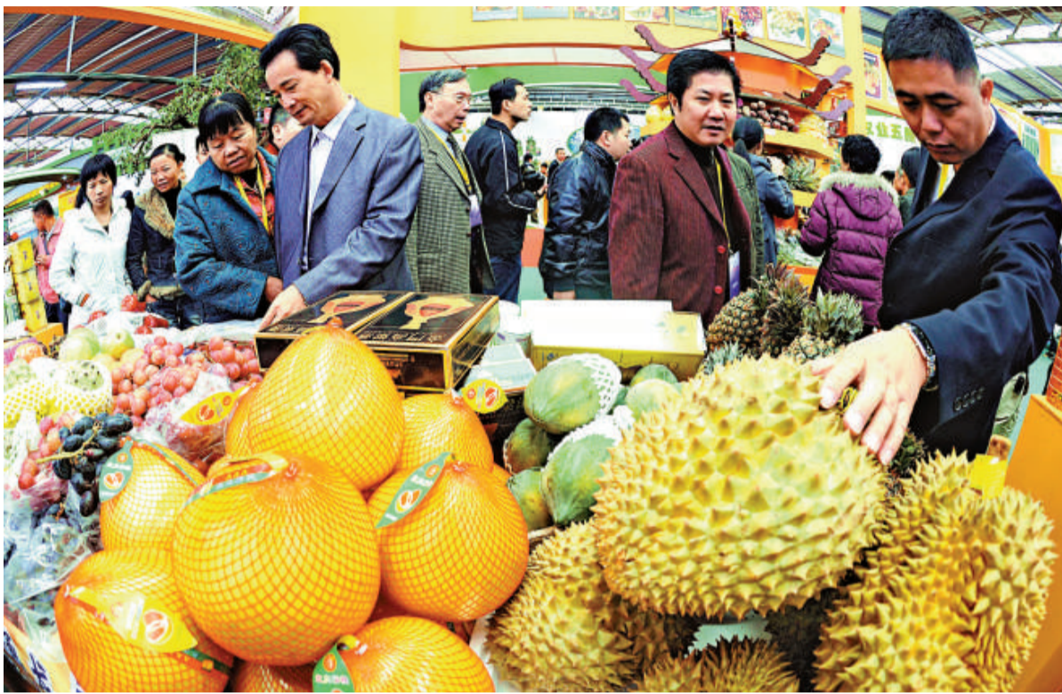
▲台灣絕大部分農產品登陸稅率將降至 5%