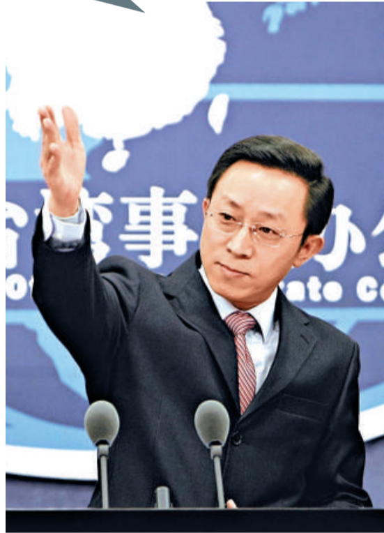
▲楊毅宣布，兩岸將於 2011 年 1 月 1 日起全面實施貨物貿易與服務貿易早期收穫計劃 中新社

另據中央社消息：馬英九日前重申「九二共識」，但李登輝、蔡英文受訪時，則否認「九二共識」的存在。國民黨副秘書長張榮恭 29 日發布新聞稿指出，馬英九高度評價「九二共識是兩岸關係的基石」，這十分重要，表明繼續推動海峽兩岸和平共榮的決心，李登輝、蔡英文則顯然背道而馳。