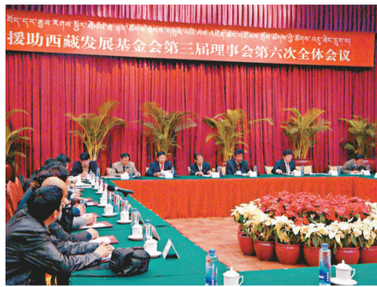
▲援藏基金會共籌集落實資金 2 億多元扶助藏民同胞

父親說，2007 年父親病重住院期間，黨和國家領導、西藏自治區黨政領導都到醫院看望慰問，給他們家人帶來了極大的寬慰。父親一生致力於維護國家統一、民族團結和促進各民族共同繁榮進步的偉大事業。