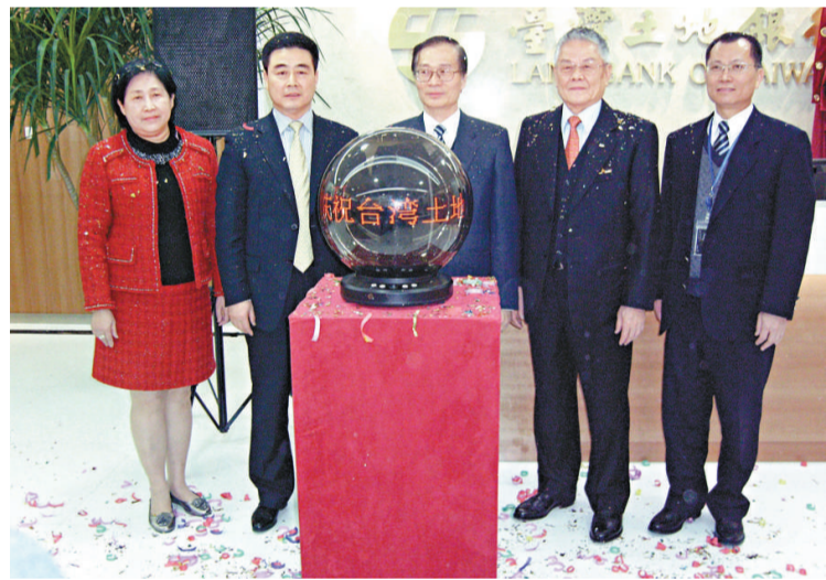
▲台灣土地銀行上海分行 29 日舉行開幕儀式

此外，台灣優良農產品商標 CAS，已經在 2010 年 11 月，經過國家工商總局商標局的審核並初審公告，公告期為 3 個月，3 個月之內只要沒有人對這個商標提出異議，就可以正式註冊。國台辦對此樂觀其成。這也是大陸方面為落實兩岸知識產權合作協議採取的一個重要舉措。