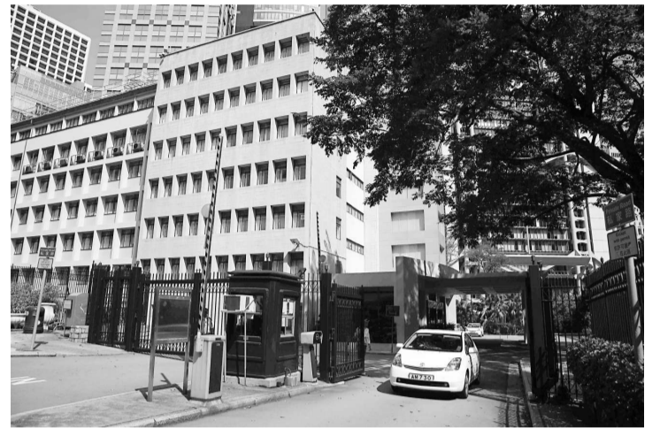
中區政府合署西座正面臨拆卸的命運

單看中區政府合署西座，或會覺得沒有什麼特別。它於一九五九年落成，外貌並不出眾，但那是現代主義強調的簡約特色。重要的是它跟中座和東座結合一起，成為一組設計相若的建築群，而中座與西座之間形成了一個鬱鬱蔥蔥的空間。若果西座變成高聳的商業大廈，日後站在紫雲閣下，將難以感受到該處曾是行政中樞所在，而新建築更會破壞政府山整體的殖民地色彩。