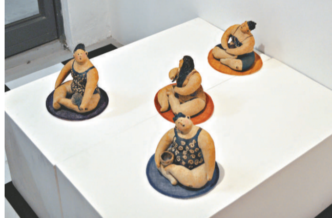
▲李慧嫻作品《聊天》中四個泥偶形態各異 本報攝