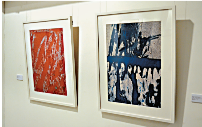
▲Norman de Brackinghe的參展作品《澳門》構圖抽象而富於活力