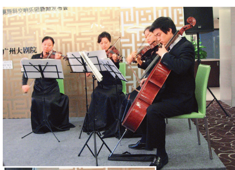
▲珠影樂團弦樂四重奏的藝術家演奏了元旦音樂會曲目片段 本報攝