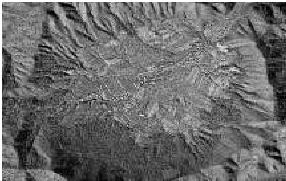
▲遼寧鞍山「羅里圈」的小山溝，被證實是中國首個隕石坑 網絡圖片

【本報訊】歷時四年，中國境內第一個地外天體撞擊構造「岫岩隕石坑」近日被證實，伴隨着這一消息傳遍全國，前來遼寧省鞍山市岫岩滿族自治縣蘇子溝鎮古龍村看稀奇的遊客紛至沓來，「中國首坑」在內地傳聞不到一個月，儘管有專家仍存異議，但當地政府顯然已經看中了這塊金漆招牌背後潛在的價值，迫不及待準備開闢。岫岩縣有關負責人近日表示，「岫岩隕石坑」初期開發規劃已出爐，該縣正以「岫岩隕石坑」為主題，規劃建設地質公園。