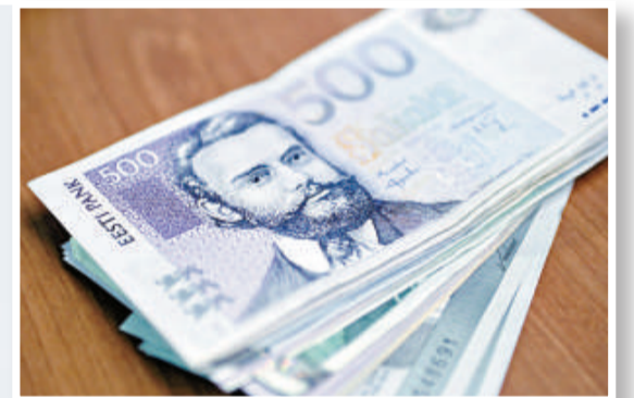
▲▲愛沙尼亞將於明年一月一日正式加入歐元區，成為第一個加入歐元區的前蘇聯共和國國家。圖為愛沙尼亞國旗及其貨幣

拉脫維亞亦準備在2014年加入，至於第三個本來會加入歐元區的波羅的海國家是立陶宛(Lithuania)，但由於該國在三年前未能符合馬克條約所規定的通脹規定，故曾在當時失去資格。