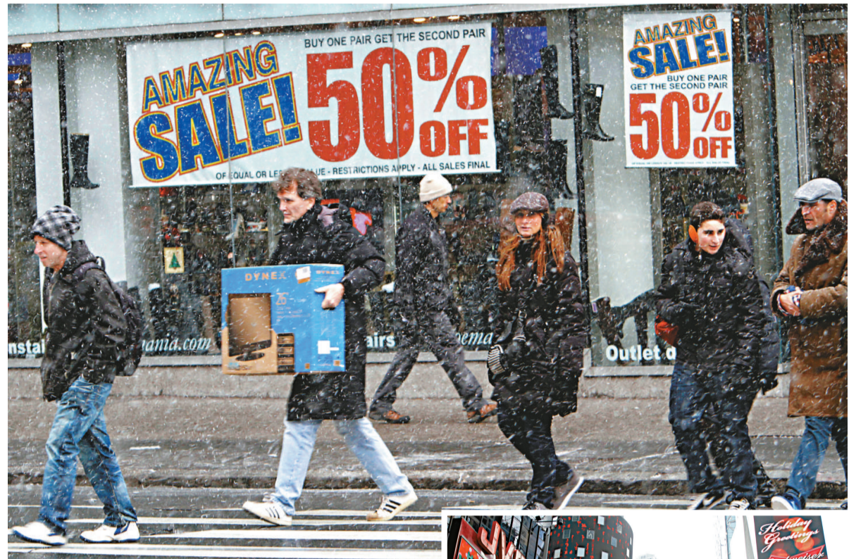
▲▲美國東北部受大風雪吹襲，令10億美元的聖誕節零售銷售額延後出現

萬事達顧問公司零售數據服務部門 SpendingPulse 公布的美國最新零售銷售額顯示，自11月5日到12月24日，除汽車銷售外，美國總零售額增長至5843億美元，比去年同期增長4.1%，甚至超過了2007年的5663