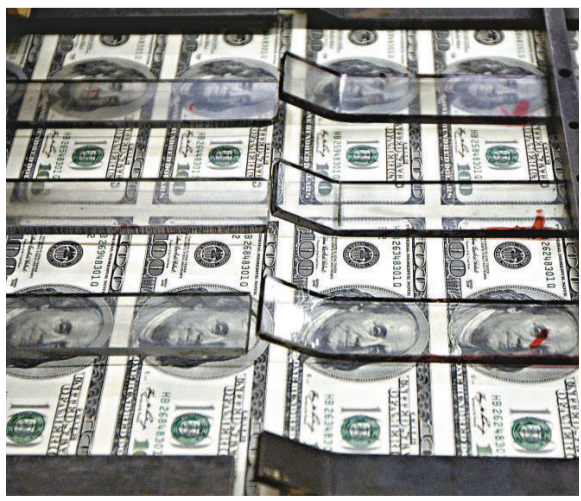
▲全球企債發行量連續第2年突破3萬億美元，反映經濟復蘇動力加強

企債市場持續復蘇，投資者預期經濟復蘇加強，借款人有能力償還貸款。總部於巴黎經合組織預測，2011年全球經濟將擴張4.2%，2012年料增長4.6%。USAA 投資管理分析指出，企債信貸質素改良，手持大量現金，有能力籌集資金，資產負債表狀況整體良好。