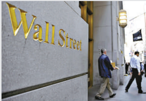
▲美國曼哈頓檢察官提出新指控，指稱一名顧問涉嫌向3間對沖基金經理提供內幕資料

11.2%，是去年同期增速的10倍多。珠寶銷售上升8.4%，是去年同期增速的兩倍多。奢侈品零售額增長6.7%，而去年同期僅增長0.9%。消費者電子產品零售額增長1.2%，去年同期下降4.6%。家具零售額增長3.8%，去年同期下降2.2%。