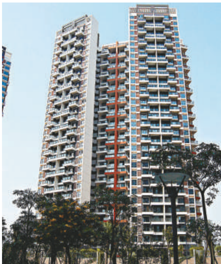
▲深圳樓市歲末又見「日光盤」

一方面是中央調控樓市信心堅決，一方面是房價再反彈，百姓怨聲四起。在2009年底，深圳官方發布的報告會曾表示：「預計年度住房價格將在市場規則和調控政策的作用下有所回調。」而現實情況是，根據已經公布的官方數據不完全統計，截至到12月29日，深圳全年新建商品住房成交均價仍同比去年上漲三成。局面完全超越了相關部門的預測。對此，深圳市規劃國土委表示，明年將繼續執行住房「限購令」，目前沒有取消的時間表。