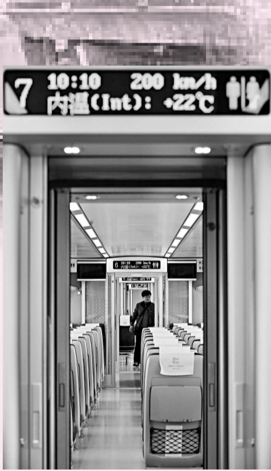
▲廣珠城際鐵路 CRH1A-250 型動車組內景