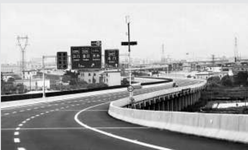
▲廣東 2010 年高速公路通車總里程達 800 公里，圖為廣珠西線通車路段

據悉，「十一五」時期（2006-2010 年），廣東高速公路建設實現跨越式發展，高速公路累計完成投資 1500 億元，為「十五」時期的 2.3 倍，新增高速公路約 1700 公里，高速公路投資額、新增通車里程和建成出省通道均創歷史新高。