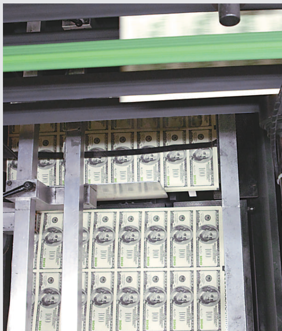
▲美國垃圾債去年升幅達15%

後市方面，分析認為，隨著美國聯邦儲備局今年將繼續刺激經濟，西方國家亦將繼續把利率維持在低水平，資金將會源源不絕，繼續湧向亞太區等資產回報高的市場，令當地股市和匯市繼續上揚。