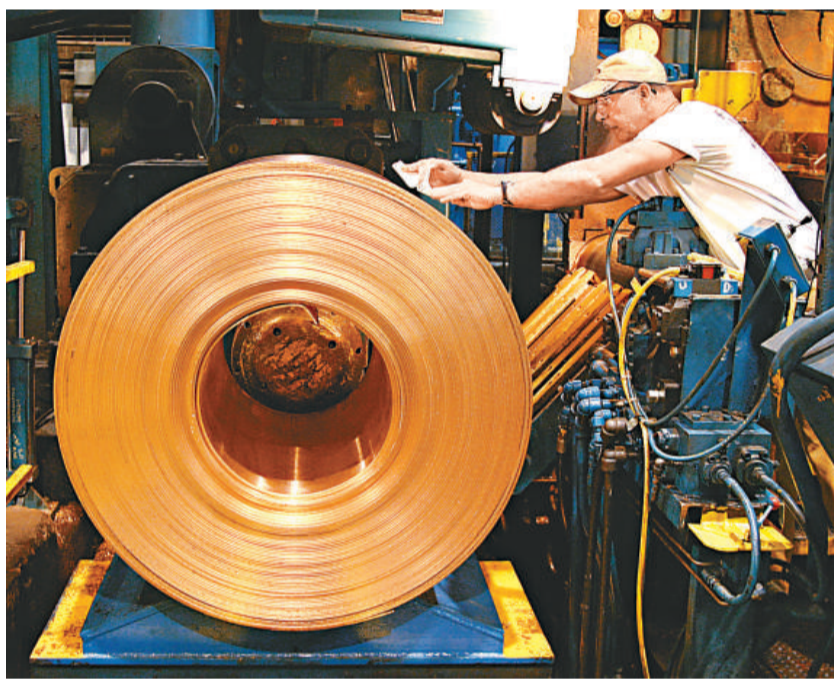
▲紐約3月份期銅期貨一度升0.8%至每磅4.3960美元

紐約銅價升至歷史高位，市場對全球經濟復蘇動力增強感到樂觀，另外貨幣匯率跌，促使投資者買商品。紐約3月份期銅期貨一度升0.8%至每磅4.3960美元，創交投最活躍合約歷史高位，超過了周四創出的每磅4.3790美元。新加坡時間報每磅4.3815美元。金價走勢偏軟，澳洲時間紐約2月份期金價格跌0.1%，報每盎司1405.20美元，連續第二個交易日下跌。現貨金價一度跌5美仙，報每盎司1404.63美元。現貨白銀升0.2%，報每盎司30.5012美元，周四一度升至30.9075美元的30年高位。