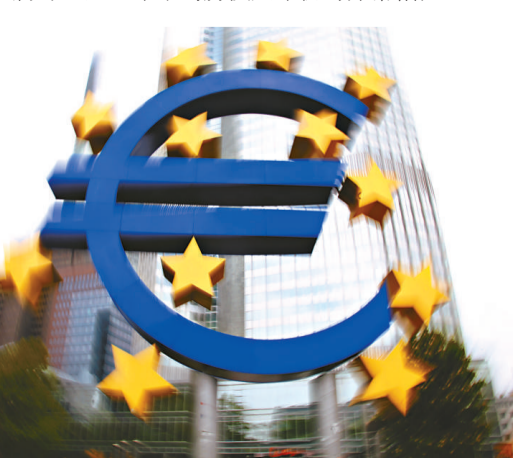
▲歐債危機或於今年春季再次來襲，歐元屆時或有崩潰可能

在市場對政府融資持續性的擔憂推高債券收益率後，歐盟（EU）和國際貨幣基金組織（IMF）相繼向希臘和愛爾蘭提供了金融援助。受發行政府債券影響，意大利借貸成本上升，德國政府債券亦在周四走高。另外，麥克威廉姆指出，英國2011年上半年房地產市場將疲軟，房價甚至會進一步下滑，只有各銀行間的放貸競爭加劇，推低借貸成本，房地產市場才有望見底。這將導致這一年末的房價與年初時非常相似。