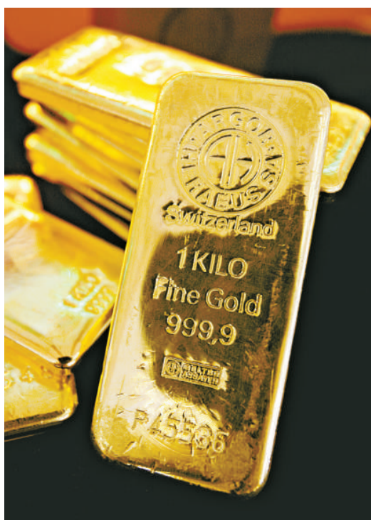
▲金價在去年全年升兩成九，是連續十年均錄得升幅

倫敦現貨金價在昨日曾升0.4%，至每盎司1410.3美元，其後略為回落至1409.93美元。紐約期金亦曾升0.3%，至每盎司1410.1美元。