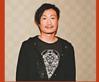
▲ 鄭中基自問非管治之才 資料圖片