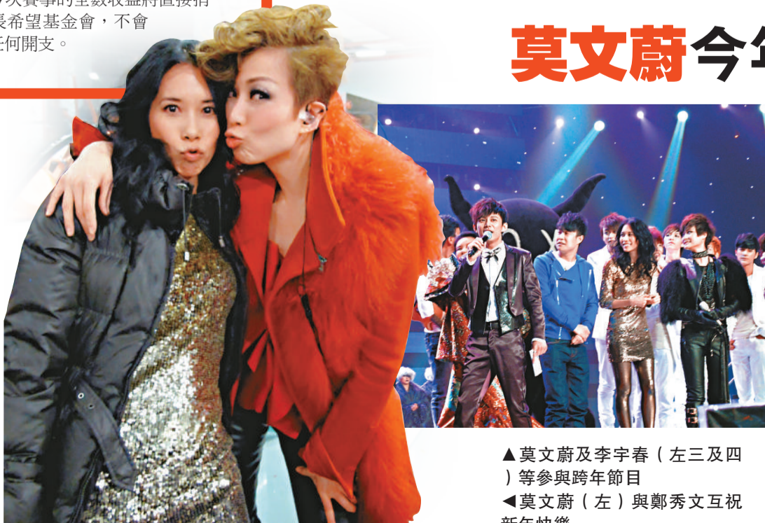
▲ 莫文蔚 (左三及四) 等參與跨年節目 ▲ 莫文蔚 (左) 與鄭秀文互祝新年快樂