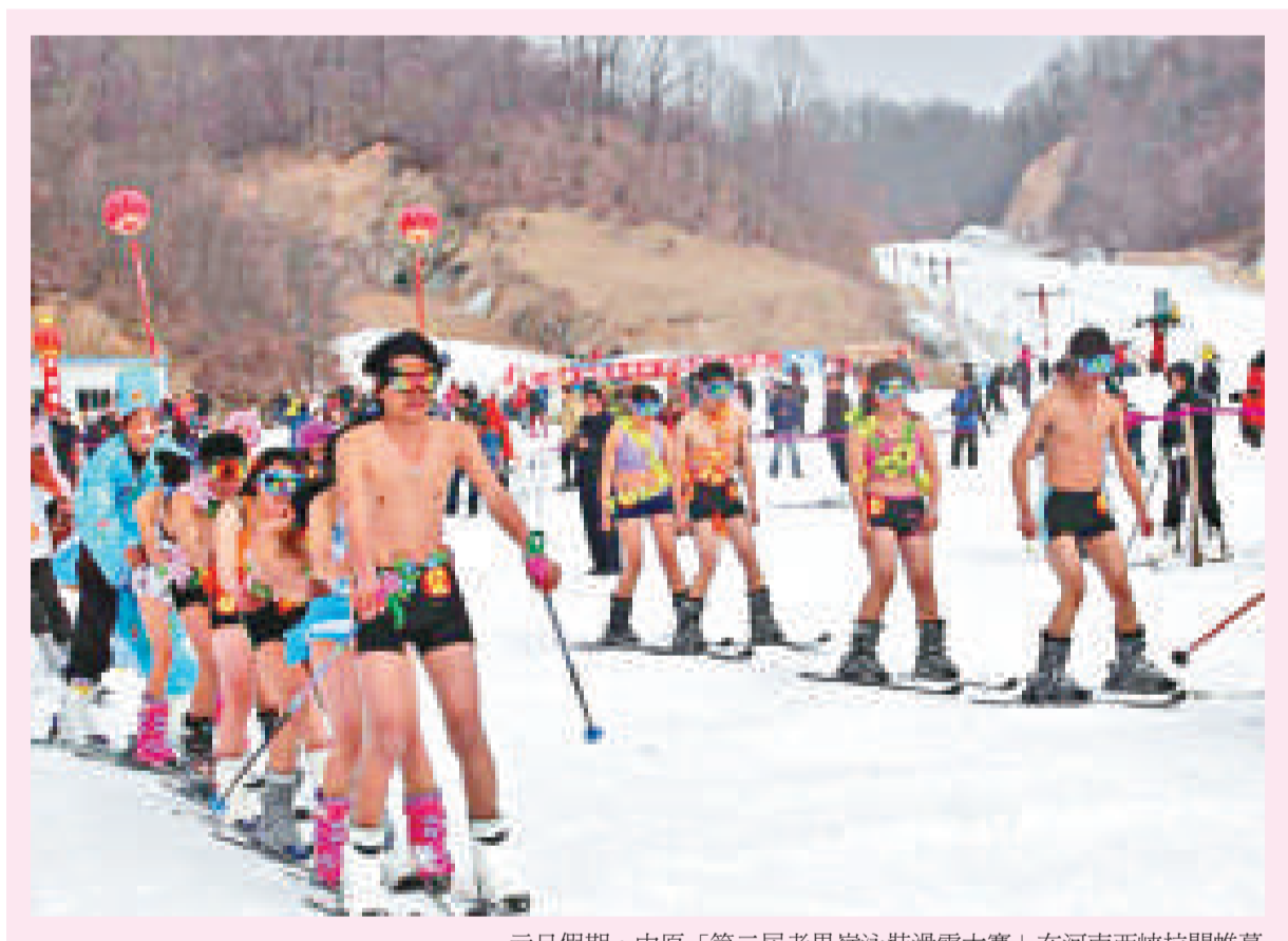
中原滑雪賽真「凍」人 元旦假期，中原「第二屆老界嶺冰雪裝滑大賽」在河南西峽拉開帷幕，高大健碩的猛男和身穿比堅尼泳衣的靚麗美女（見圖），在白雲皚皚中登場，展示「零度英雄（英雄）」的「凍」人形象。經過激烈角逐，七名選手分別獲得最雷人獎、最佳服裝獎、最受歡迎獎、最佳表演獎、最佳男子（女子）技能獎和滑雪王子，分別贏得1000元至5000元不等的獎金。

還有網友無奈感嘆，近年來孩子們的「閱讀禁區」似乎越來越多，「魯迅無奈地走了，朱自清的《背影》也越來越遠，最終消失在地平線。」