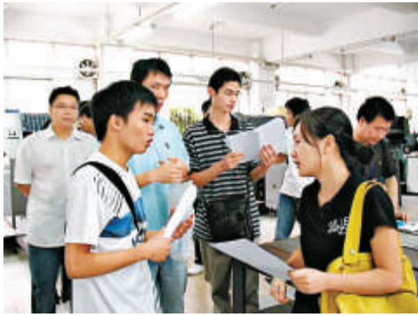
▲廣東將有100名來自新生代農民工的「幸運兒」，通過選拔實現自己上北京大學的夢想