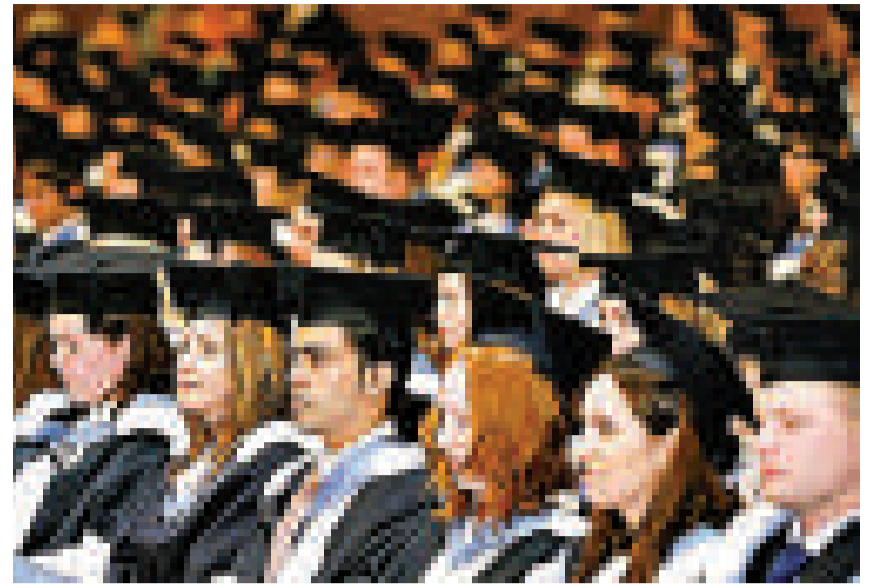
▲為趕在學費漲價前入學，英國今年湧現了大批提前申請者

配給，使它更昂貴，而其他國家都在投資於大學，我國在世界舞台上的地位受到威脅。」 上月，英國下議院通過了把大學學費上限從3290鎊大大調高至9000鎊的議案。12月20日，已有34萬4064名中學生申請2011/2012年度的大學學位，較去年同期多了2.5%。UCAS資料顯示，19歲申請人增加了近8%，20歲申請人則增加了12%。 英格蘭的申請人增加了3.3%，因為英格蘭學生受學費上調政策影響最為明顯。不過，威爾士政府已承諾保持大學學費不變，蘇格蘭學生則繼續不用付學費，北愛爾蘭則尚未公布計劃如何。