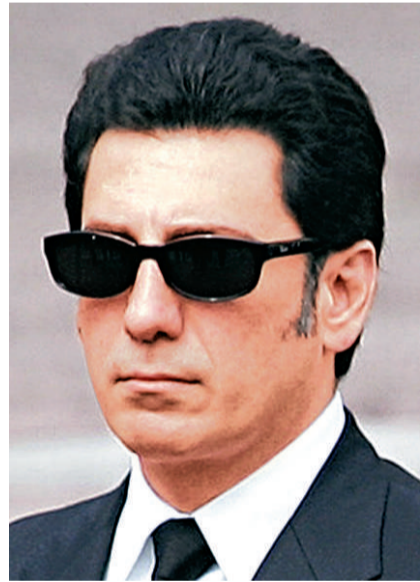
的小女兒勒拉·巴列維公主在倫敦酒店中服藥過量死亡，時年31歲。 巴列維王朝曾得到美國政府的堅定支援，1979年伊朗爆發伊斯蘭革命，巴列維王朝被推翻，此後巴列維家族的多名成員便一直流亡生活在美國。

【本報訊】綜合伊朗Press TV、payvand新聞網和美國彭博社報導：伊朗已故前國王巴列維最小的兒子4日在位於美國波士頓的家中自殺身亡，據稱他生前曾飽受慢性病的折磨。 波士頓當地時間4日凌晨2時11分，伊朗已故前國王巴列維的幼子阿里·禮薩·巴列維（見圖）在家中自殺身亡。他的哥哥、巴列維國王的長子禮薩·巴列維當天在其個人網站上向外界透露了這個消息，並稱44歲的弟弟多年來飽受慢性病的折磨。巴列維家族發言人也通過聲明表示，阿里·禮薩多年來一直承受着失去父親、妹妹的痛苦，也為國家飽受欺凌而痛心。 阿里·禮薩生於1966年4月28日，1979年伊斯蘭革命後，他隨家族定居美國，1984年在普林斯頓大學獲得學士學位，1992年在哥倫比亞大學獲得碩士學位，後來他又進入哈佛大學攻讀博士，研究古代伊朗的歷史。阿里·禮薩的母親透露，他至今未婚，生前酷愛跳傘、飛行、閱讀。 阿里·禮薩是巴列維家族中第二名自殺身亡的成員。2001年，巴列維國王