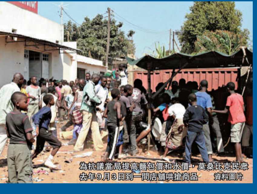
為抗議當局提高麵包價和水價，莫桑比克民眾去年9月9日回到一間店舖哄搶商品 資料圖片

【本報訊】據彭博社五日消息：聯合國的最新統計數據顯示，受到糖價、肉價高漲影響，去年12月全球糧食價格飆上紀錄新高，突破2008年「糧食危機」水準。