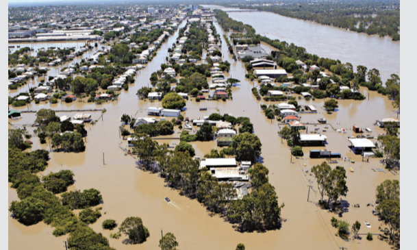
▲澳洲洪災持續加重，羅克漢普頓市已完全浸在洪水中

【本報訊】綜合外電報導：澳洲大洪災已蔓延到40座城鎮，而且隨着成噸污水泄入大海，連世界著名的大堡礁也受到威脅。 昆士蘭北部詹姆士庫克大學研究員德夫林表示，澳洲東岸向大海傾泄的污水，或會破壞大堡礁。她說，夾帶垃圾與農藥的洪水，對大堡礁來說是有害液體。大堡礁是世界最大的礁石群，既是珍貴的生態寶藏，也是主要旅遊景點。 德夫林稱：「這真的是件大事，因為有可能會轉變食物鏈，也有可能改變礁石的運轉模式。」 澳洲昆士蘭州長布萊前表示，澳洲這一波破紀錄的洪水，對昆士蘭州的設施造成災難性破壞，並迫使州內75%的煤礦山停產。煤礦出口大減，亦推高世界煤礦價格。