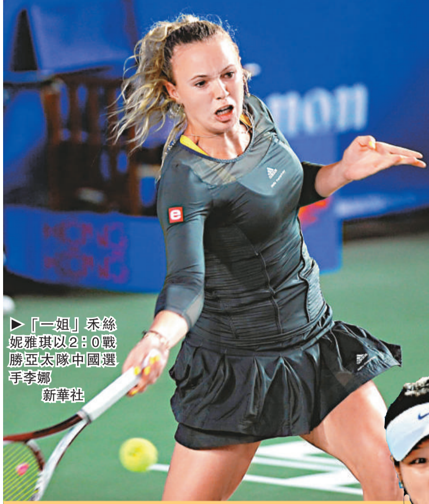
▶「一姐」禾絲妮雅琪以2：0戰勝亞太隊中國選手李娜 新華社

【本報訊】香港網球精英賽於昨日在維園網球場「開拍」，亞太隊隊長、中國球手李娜出師不利，以盤數0：2不敵歐洲隊的「丹麥甜心」禾絲妮雅琪。揭幕戰方面，亞太隊張玲（香港）以盤數0：2負於歐洲隊蕾莎伊（法國）。賽事今日將進行俄羅斯隊對美洲隊的準決賽。（now636台香港時間周四下午4時30分起直播）