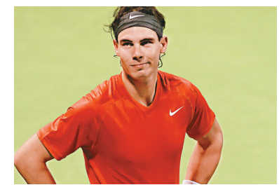
▲拿度勝出今年首場正式比賽

綜合外電卡塔爾四日消息：「一哥」拿度和「瑞士球王」費達拿，雙雙以勝利來開始本年度正式比賽，於周二的卡塔爾公開賽首圈旗開得勝。拿度以6：3、6：0輕取斯洛伐克的碧克，而費達拿就以7：6(7：3)、6：4打敗荷蘭的舒奧利爾。