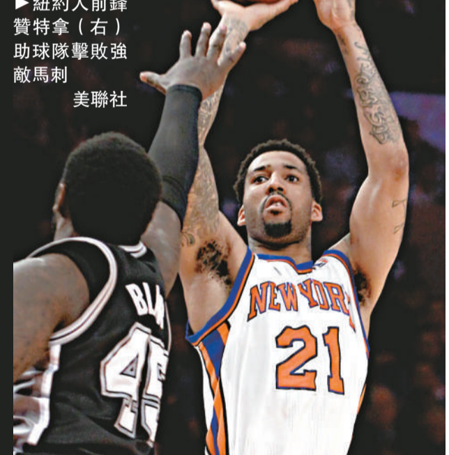
▶紐約人前鋒贊特拿(右)助球隊擊敗強敵馬刺