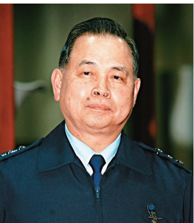
▲台空軍司令雷玉其爆發「公器私用」爭議，被調職下台。中央社

【本報訊】綜合中評社及中央社6日報道，台空軍司令雷玉其於元旦為兒子舉辦婚宴，官兵不只幫忙婚宴，還撰寫婚宴企劃書，引發爭議；馬英九要求政府機關首長遵守公務員廉政倫理規範，尤其應以身作則，做好正己示範；雷玉其今天調任參謀本部空軍副參謀總長。「總統府」發言人羅智強表示，馬英九對這件事情