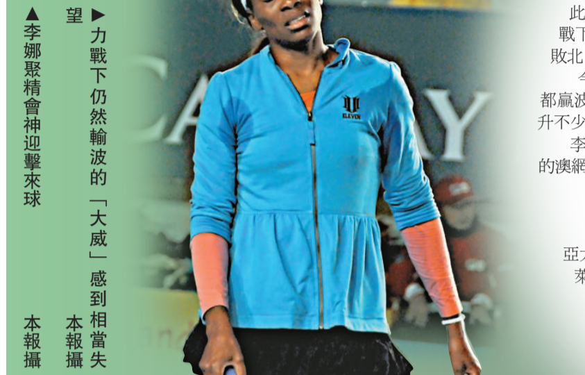
李娜聚精會神迎擊來球

在昨日的頭場比賽，亞太隊的香港代表張玲雖然以3:6、1:6不敵美國的奧汀，但亞太隊壓陣出場的澳洲老將菲臘普西斯，在男單比賽以6:4、6:4擊敗美國名宿麥根萊，現亞太隊暫時以場數2:1領先。優秀組最後一場混雙將於今日上午進行。卓越組賽事今日將上演巔峰對決，歐洲隊的世界排名第一球手「丹麥甜心」禾絲妮雅琪，將會硬撼世界排名第二、俄羅斯的施雲娜莉娃，上演卓越組冠軍戰。同日亦會進行一場男單及一場混雙比賽。