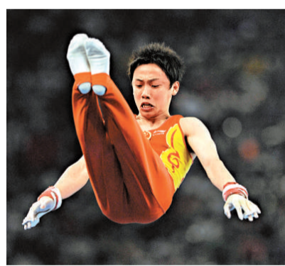
京奧體操三冠王鄒凱，希望新年再崛起

最讓陳一冰高興的是，他已經完全適應了隊里的新角色，與隊友們關係也越來越好，10月份的世錦賽暨倫敦奧運資格賽是中國體操隊2011年最關鍵的一場戰役。「因為比賽在日