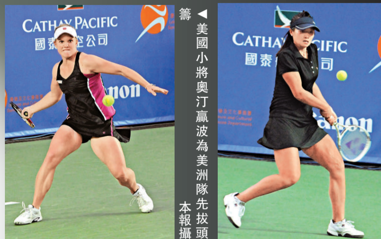
美國小將奧汀贏波為美洲隊先拔頭籌

【本報訊】香港網球精英賽昨日進行優秀組決賽，「中國金花」李娜擊敗「大威」維納斯·威廉斯，協助亞太隊以場數2:1領先美洲隊。今場比賽李娜與「大威」爭持激烈，賽事初段互相保住各自的發球局。首盤的轉捩點出現在第8局，李娜把握機會打破「大威」的發球局，領先5:3；之後一局「金花」保發成功，以6:3先贏第一盤。第二盤李娜保持強勢，在第7局再次破發，領先局數4:3。陷於出局邊緣的「大威」此時發威，立刻反擊，打破李娜發球局，隨後再贏一局反以5:4。不過李娜之後力戰下保住發球局，雙方要以tie-break分勝負。「大威」在tie-break無以為繼，以3:7敗北，最終以6:7輸掉第二盤，李娜直落兩盤勝出。 今次是李娜職業生涯第3次擊敗「大威」，此前在北京奧運及去年的澳網，「金花」都贏波而回。李娜賽後滿意自己的發揮，她認為自己的狀態比起日前負于禾絲妮雅琪時提升不少，李娜說：「我今仗的表現還好，入夜後氣溫下降，但我仍能保持水準。」李娜表示主場之利幫助自己甚大，李娜今日離港，她強調將會全身心投入備戰即將展開的澳網賽事。