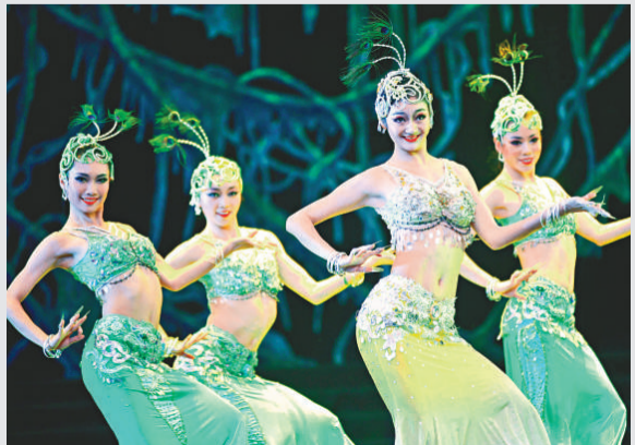
▲由大陸著名編導陳維亞協同大陸最頂尖的中國東方歌舞團百人陣容，於8日至9日在台北演出2場招牌節目「秘境之旅」，與台灣觀眾共享藝術饗宴，這也是中國東方歌舞團首次訪台演出

【本報訊】據中通社8日消息：受到景氣回升，以及兩岸簽署經濟合作框架協議(ECEA)效應帶動，去年台灣整體民間重大投資金額達10698億元(新台幣，下同)，僅次於2008年的10882億元，創歷年新高紀錄。