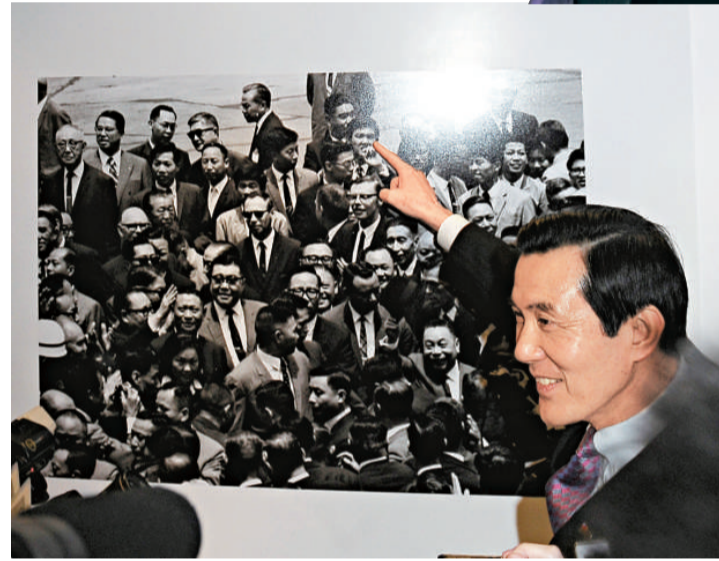
▲馬英九手指自己40年前大二學生的青澀模樣