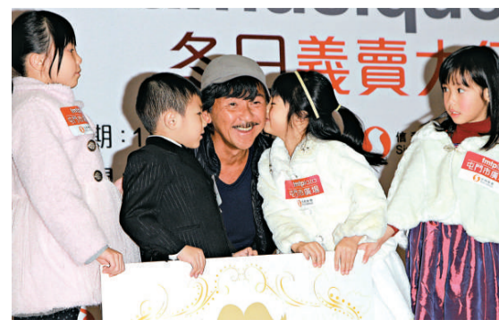
▲ 阿 Lam 出席捐贈義賣活動，與小朋友齊合照

提到莎莉前晚以性感大露背裝示人，阿 Lam 笑言在家裡已看到，因太太試衫有問他意見，他笑道：「我話 OK，但會凍瓜你！不過一上台唱歌就會熱起