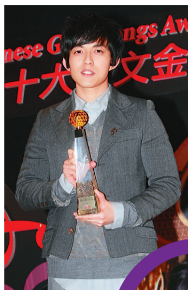
▲ 林宥嘉表示不想分享與 G.E.M. 的戀情