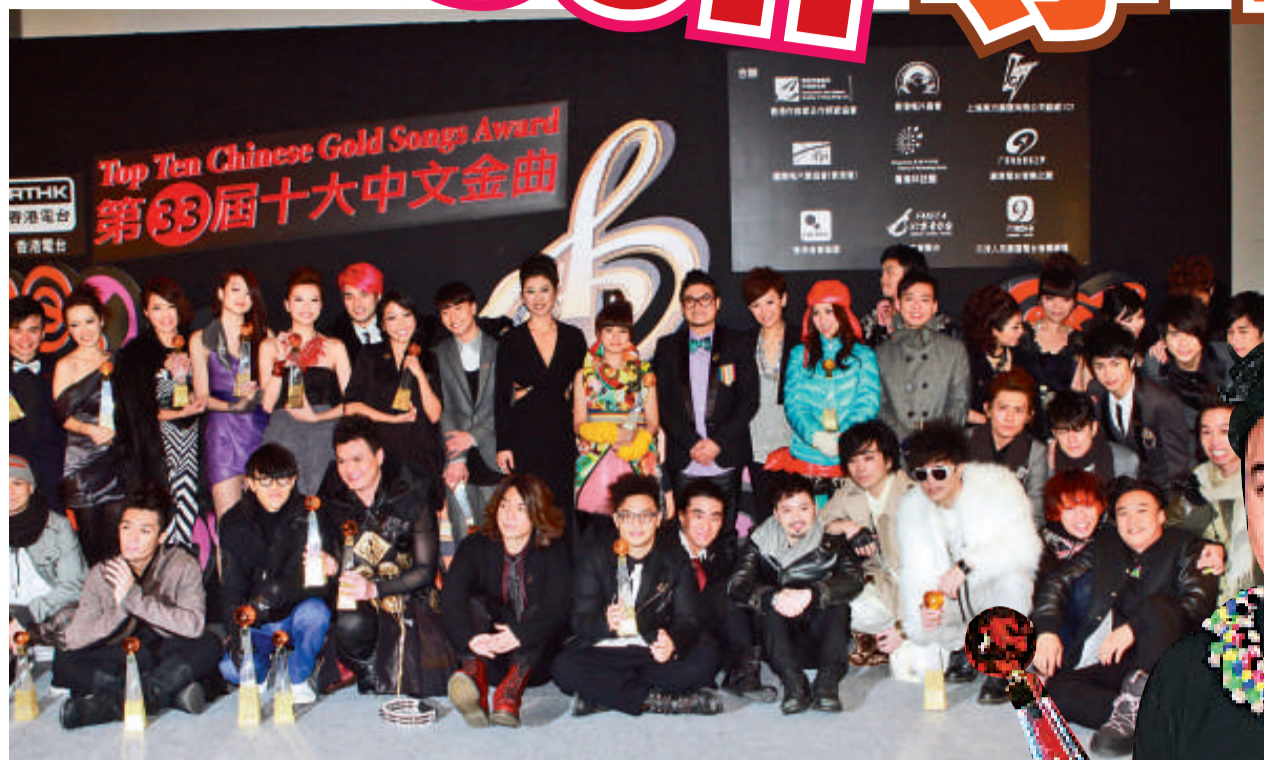
▲港台頒獎禮遭亞和英皇杯葛，出席歌手頗為凋零