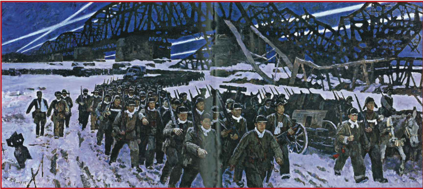
▲《跨過鴨綠江》 吳雲華（油畫）