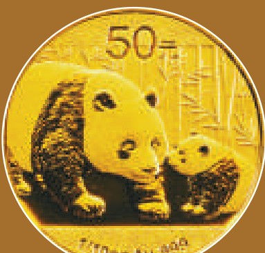
▲熊貓四分之一 盎司金幣背面

至於1盎司熊貓普製銀幣的發行量增加到史無前例的300萬枚，表面上似乎會讓人感覺市場很有可能不堪重負，但當今的市場承受能力可能遠沒有大家想像的那麼柔弱。因為在有關部門沒有公告的情況下，2010年版熊貓1盎司銀幣的發行量已經增加到了150萬枚，且目前供不應求的局面依然存在。如果2011年的錢幣市場行情繼續走強的話，有相當發行規