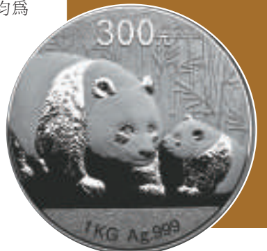
▲熊貓一公斤銀幣 背面