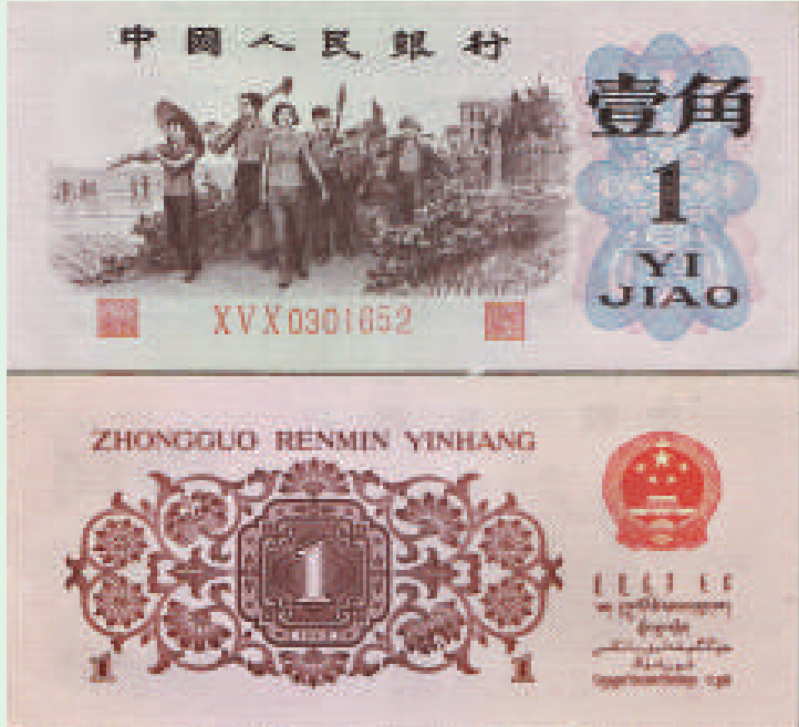
▲背面為褐色的一角錢為常用券