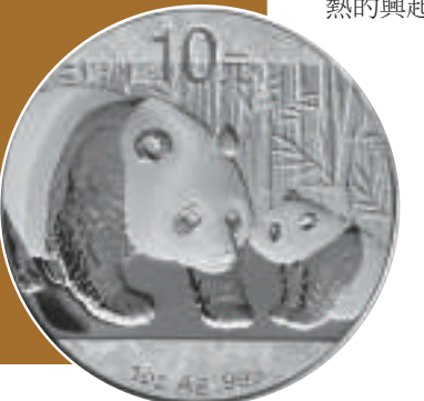
▲熊貓一盎司銀幣 背面

模的2011年版熊貓1盎司普製銀幣，很有可能成為各方資金爭相爭奪和炒作的重要目標之一。1996和1997年版的1盎司熊貓普製銀幣在97年的郵市狂潮中被炒高到每枚800—900元人民幣的景象，完全有可能在2011年再度重演。