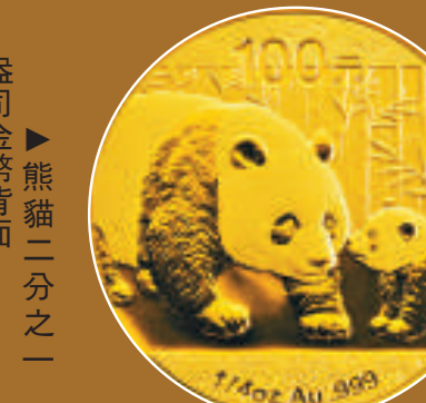
▲熊貓二分之一 盎司金幣背面