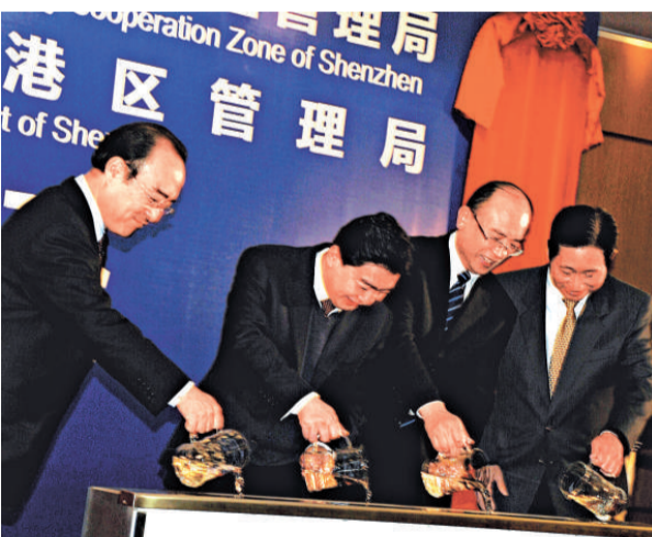
▲深圳市委書記王榮（左二）、市長許勤（左三）等深圳官員將四海之水注入代表前海的水箱