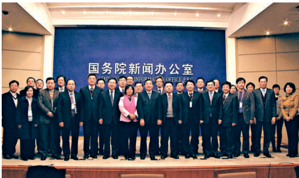
▲王晨（前排中）與香港傳媒界高層訪京團親切合照

王晨說，去年物價上漲和通脹是比較受關注的問題，11月份CPI同比上漲5.1%，社會上有一些恐慌。但國務院及時調控物價，取得了明顯的效果，十二月份有所緩和，全年CPI漲幅大約在3%左右，在可控範圍內。