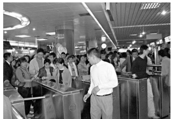
▲縱火事件發生後翌日，地鐵人流依然火爆，並沒有嚇退乘客