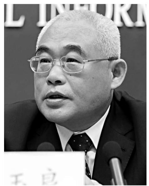
▲中紀委六次全會增選吳玉良為中紀委副書記 資料圖片

2007年11月，中共十七大之後，吳玉良出任中紀委常委、秘書長、機關黨委書記，成為中紀委機關的「大管家」。他同時還是中紀委的新聞發言人，去年12月29日的新聞發布會上他曾表示，對官員財產申報一直抱着積極推進的態度。