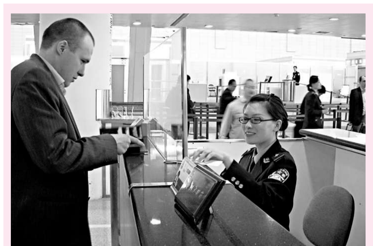
▲上海邊檢部門今年啓動的「開門評警活動」首次邀請境外人士監督執法 本報攝