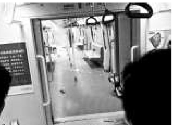
▲地鐵發生縱火後現場，當時列車正由小北站駛往火車站

「起火了！嚇死我！就在我隔離……」事發後幾分鐘，有網友「Husson_Wong」在網絡發出一條「地鐵驚