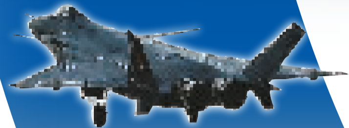
▲殲-20試飛約18分鐘 網上圖片

中國首款國產隱形戰機殲-20今日12時50分在成都成飛機場進行首飛測試，殲-10S教練機陪伴飛行約18分鐘後成功降落。機場內，有官方和軍方高層領導，還有成飛集團員工觀看試飛；機場外，則聚集了大批記者和軍迷，在殲-20完成首飛後，機場內外歡呼聲一片，軍迷還放鞭炮慶祝。