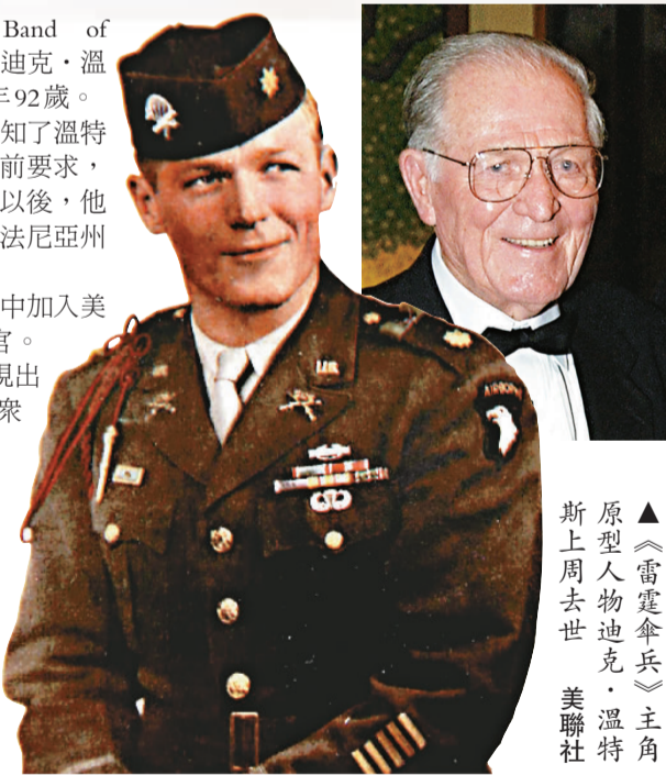
▲《雷霆傘兵》主角原型人物迪克·溫特斯上周去世