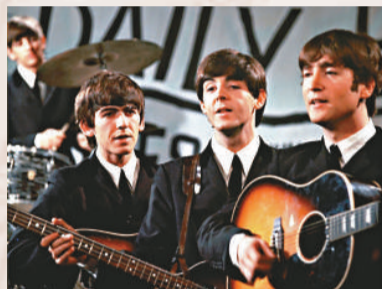
▲披頭四的搖滾樂風靡至今