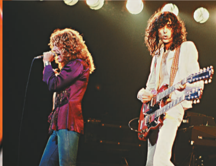
▲Led Zeppelin是重金屬搖滾的代表人物之一