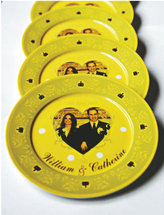
▲英國威廉王子大婚的紀念品已被搶購一空