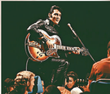
▲貓王是第一位紅透半邊天的搖滾巨星