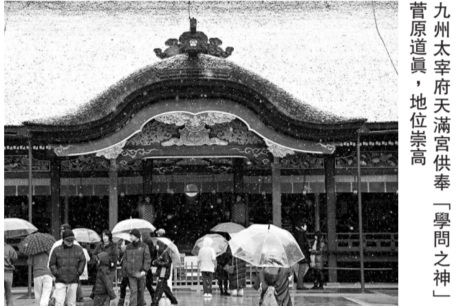
九州太宰府天滿宮供奉「學問之神」菅原道真，地位崇高。