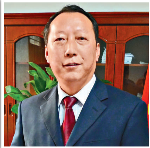
武安市人民政府市長李明朝

按照「邯鄲休閒後花園，區域度假首選地」，擦亮「中國優秀旅遊城市」品牌。四個國字頭品牌為龍頭，磁山文化博物館、晉冀魯豫革命歷史紀念館等歷史文化景區配套建設工程已收尾，東板山、七步溝、古武當山等旅遊資源實現整合和上檔升級，武安國家地質公園正式開館迎客。構建了生態遊、文化遊、紅色遊三條精品線路，借助邯武快速路，引進國內外著名商貿服務企業，打造四省交界區服務業發展高地。