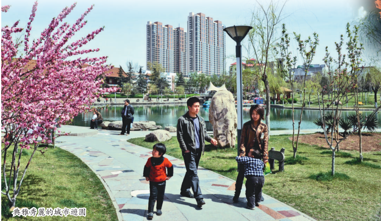
典雅秀麗的城市遊園

如今的武安，城鎮化率已達52%，三年大變樣工作被稱為全省十佳紅旗縣市，這座冀南大地上的新興中等城市正在迅速崛起。