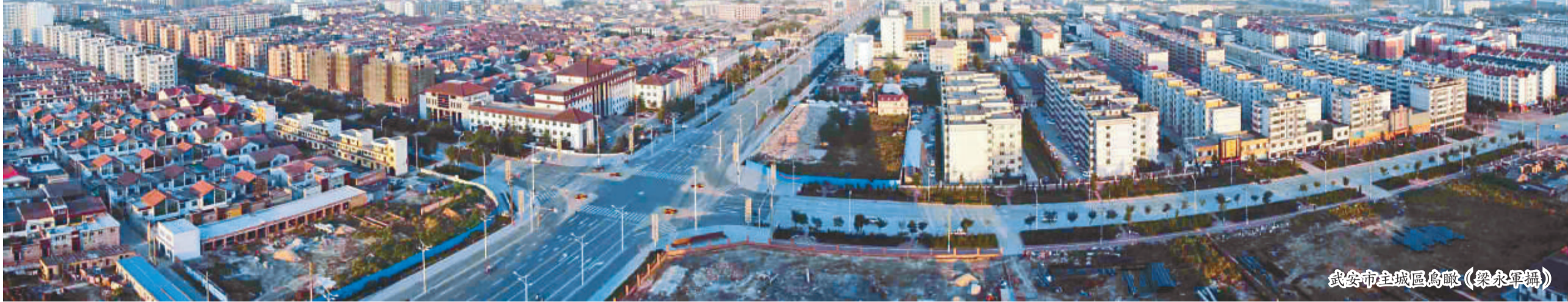
武安市主城区鳥瞰