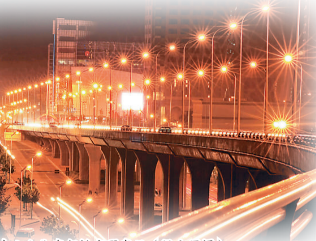
中山大街高架橋亮麗奪目