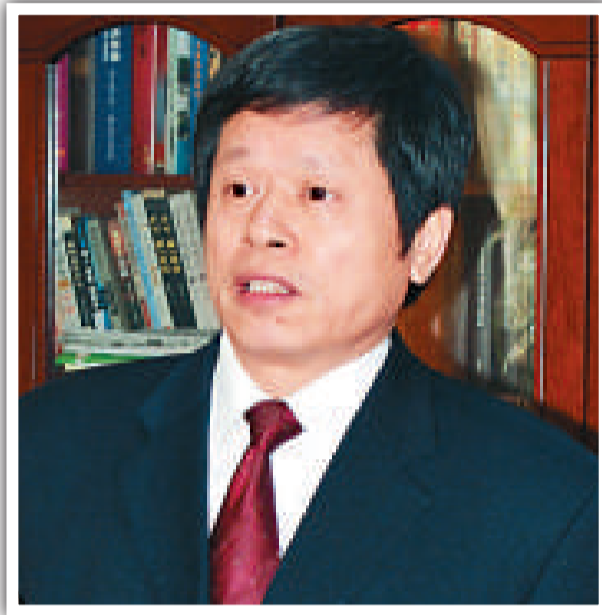
中共武安市委書記孟廣軍

在過去的5年裡，武安先後實現了「鐵變鋼、鋼變材」兩大跨越，裝備製造、精密鑄造兩大接續產業茁壯成長，以物流、旅遊、服務業為新經濟增長點產值比例的不斷攀高，社會經濟呈現出活力充盈、實力驟增、動力強勁的勢頭。生產總值年均遞增13.3%，財政收入年均遞增14.3%，被國家列入可持續發展實驗區。5年時間，武安堅持將經濟發展和城市建設、民生工程、社會事業統籌兼顧。先後榮獲「國家園林城市」、「國家科技進步示範縣（市）」和「中國優秀旅遊城市」等稱號。一座宜居、宜業、宜商、宜旅的現代化城市使人們的幸福指數節節攀高。