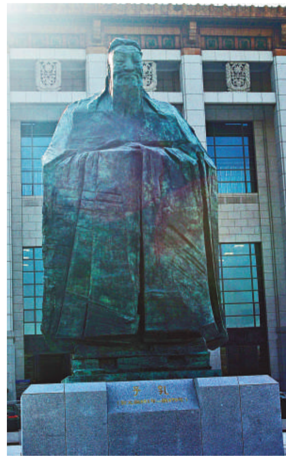
▲亮相在天安門東側的孔子雕像

其實，對於每個國家、每個民族，尤其是正在進步和崛起中的國家和民族，文化的自我尋根原本是必須要做而且要做好的。沒有任何一個民族能夠在將民族傳統文明自我開創後，僅僅依靠某種單一的政治說教而實現發展。無論是儒是道，是法是墨，聖賢先哲們千百年來對本民族內心的深刻體察與關照所產生的璀璨思想，自有其不朽的價值。孔子所倡導的仁義、智慧、誠信、和善，是中國傳統文化中最高貴的氣質，也恰恰是現在中國發展所迫切呼喚的。多一分仁義，多一分智慧，多一分誠信，多一分和善，則會少一個「我爸是李剛」，少一分帶血的GDP，少一樁野蠻拆遷之後的慘烈自焚。【本報北京十二日電】