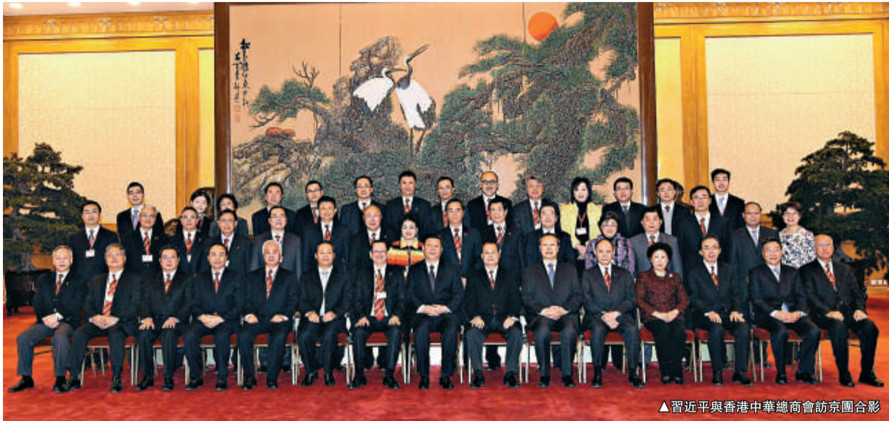
▲習近平與香港中華總商會訪京團合影

國家副主席習近平今日上午在北京人民大會堂會見由會長蔡冠深率領的香港中華總商會第四十七屆董會一行。習近平充分肯定中總為保持香港繁榮穩定所作出的貢獻，並強調中央和地方盡心竭力地考慮如何支持香港，所採取的一系列舉措本身，對內地和香港都是互利共贏的。