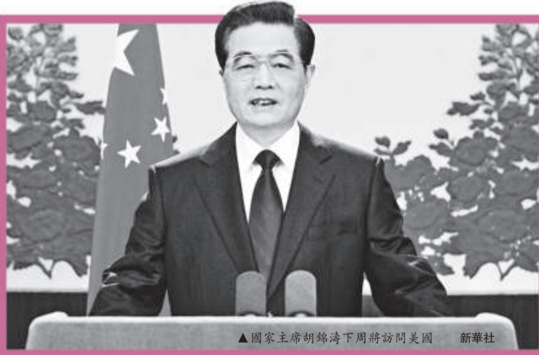
▲國家主席胡錦濤下周將訪問美國 新華社

他說，當前國際形勢繼續發生深刻複雜變化，全球性挑戰日益增多，各國相互依存更加緊密。作為世界上最大的發展中國家和最大的發達國家，中美兩國在事關世界、特別是亞太地區和平與發展的一系列重大問題上擁有廣泛共同利益，面臨諸多共同挑戰，負有重要共同責任。崔天凱確認，朝鮮半島核問題、貿易問題、人民幣匯率形成機制改革問題、中國在美資產安全問題等都將在會談中觸及，但「稀土出口並不是中美間的一個問題，也不應該成爲一個問題。」預料兩國元首會談將就「如何推動21世紀積極全面合作中美關係如何發展，如何確定中美關係今後發展的方向等，都將達成新的重要共識；在加強人民往來、人文交流方面也將取得相當多的成果；在重大的國際地區問題上進一步協調、溝通；在經貿合作方面，也會取得重大的、廣泛的、重要的成果，這些成果將體現兩國經貿越來越緊密的聯繫，體現互利雙贏的精神。」