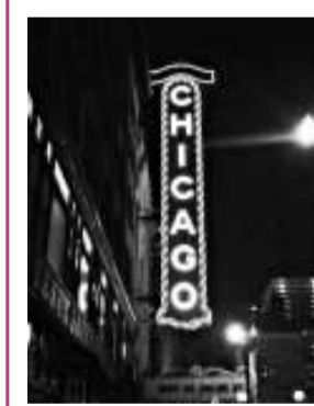
胡錦濤20日訪問芝加哥

崔天凱說，把航行自由問題放在南海問題中是混淆概念。「南海航行自由不存在任何問題，大家也沒聽說過有哪個國家的航船在南海的航行受到影響。既然不存在這個問題，就不要無中生有。」