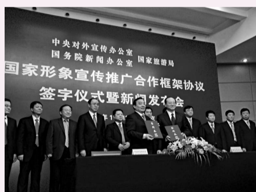
▲今天下午，中央外宣辦、國務院新聞辦和國家旅遊局共同簽署了「關於開展國家形象宣傳推廣合作框架協議」。圖為：中央對外宣傳辦公室、國務院新聞辦公室主任王晨（第一排左）與國家旅遊局局長邵琪偉簽署協議

主任王晨指出，今年是我國「十二五」規劃的開局之年，也是不斷展示、提升中國良好國家形象，加強中國軟實力建設的一個大好契機。旅遊業是一個與國家對外傳播和國家形象塑造非常密切的行業、產業。一個國家的旅遊資源豐富，國家形象好，吸引的海外遊客就多，而遊客的口碑是對一個國家最好的宣傳。