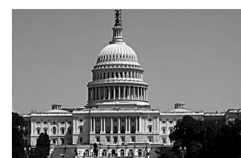
胡錦濤18日訪問華盛頓