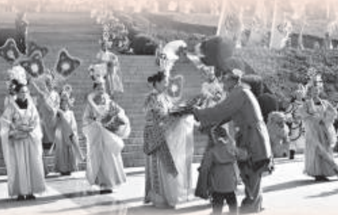
▲ 媧皇宮每天上演的大型舞蹈《媧皇頌歌》

在重點建設媧皇宮的同時，涉縣修復了千年古剎熊耳寺、漢代的清泉寺，保護開發靜因寺、柏台寺、千佛洞等古跡，以媧皇宮為龍頭，將各古跡連起來形成古文化旅游線路。