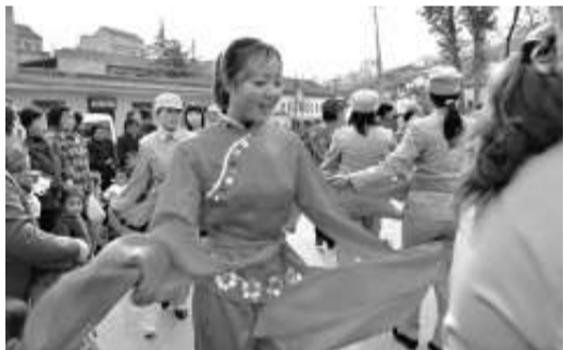
129師劇社在向遊客演出

投資8000餘萬元對129師陳列館改陳啟新，建設了2700平方米舊址廣場、15000平方米陳列館廣場、2000平方米遊客服務中心，將軍嶺步遊道、舊址環線等工程。完善了旅遊住宿、旅遊餐飲、旅遊購物等服務設施。目前，又在積極推進計劃投資2.3342億的129師陳列館改陳建項目，將對129師陳列館、八路軍大伙房進行改擴建，建設生態水面、服務中心、陳列館廣場和劉張公路連接道、射擊場等，項目完工後129師司令部舊址景區將成為集主題教育、休閒觀光為一體的知名紅色旅遊勝地。