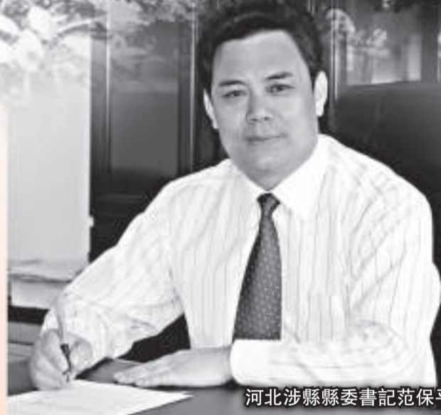
河北涉縣縣委書記范保平

范保平說，涉縣把旅遊業作為朝陽產業大力發展，以打造「全國旅遊強縣」為目標，整合資源、開發建設、創新機制，打出了古文化旅游、紅色文化旅游和生態民俗旅遊「三張牌」。2010年「十一」黃金周，129師司令部舊址、媧皇宮和五指山三大景區，接待遊客近10萬人次。