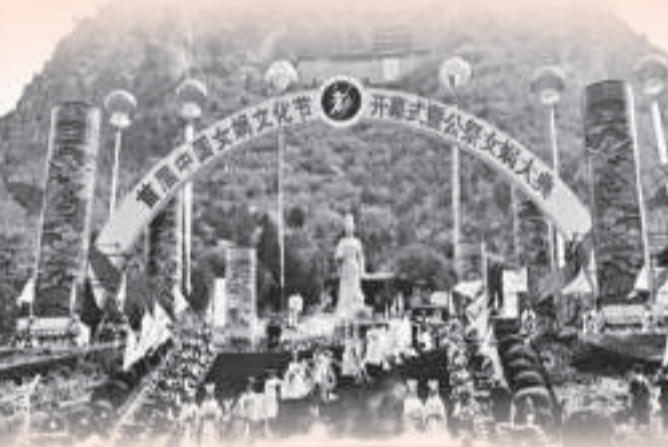
首屆中國女媧文化節開幕式

涉縣是一個有悠久歷史的千年古縣，文化底蘊深厚，人文古跡遍布全縣。現已發現古人類、商周和戰國、漢文化遺址30多處，寺、廟、觀、石窟、石刻等古建築300多處。涉縣是神話傳說中女媧「煉石補天，搏土造人」的地方，境內的媧皇宮是全國建築規模最大、時間最早的祀奉始祖女媧的古建築群，被譽為「華夏祖廟」，媧皇宮內的摩崖刻經面積達65平方米，有經文13.7萬多字，被稱為「天下第一壁經」。