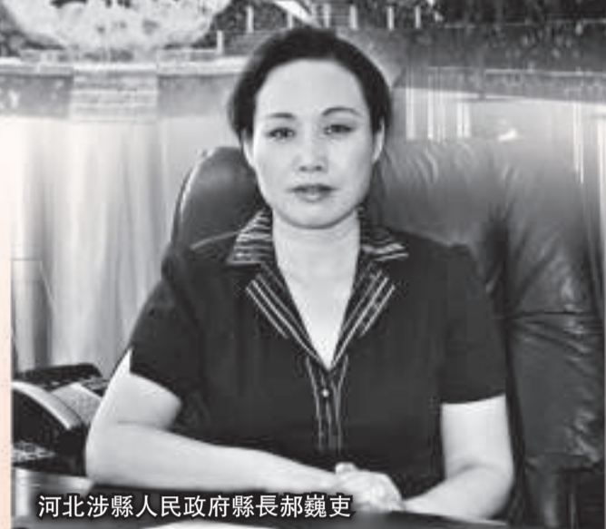
河北涉縣人民政府縣長郝銳娟