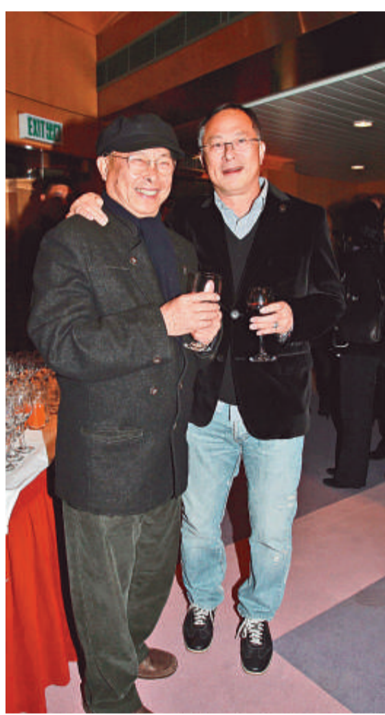
▲杜琪峯（右）出席活動，與好友劉兆銘相遇

阿杜表示之前在拍《奪命金》，亦即將完成，之後會開拍古天樂與鄭秀文（Sammi）主演的新片，計劃到香港里拉海拔四千米高的地方取景拍攝。他指古仔與Sammi 當年曾到峨眉山拍《百年好合》，所以不擔心Sammi 的身體狀況，反而會擔心古仔多一點，因為古仔最近身體不太妥當，怕他的腳傷不知會否上到。他又謂屆時會讓大隊留在二千米高的地方住一日，大家適應了環境才再上高地拍攝。