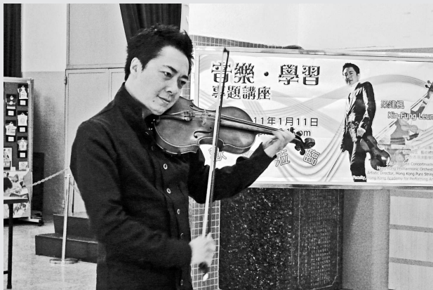
▲啓基學校（港島），近日邀請香港管弦樂團第一副團長兼著名小提琴家梁建楓，擔任學校的音樂顧問