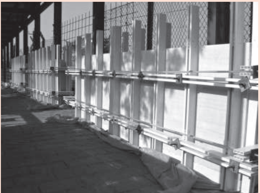
顯龍產品正用於香港科學園第三期工程