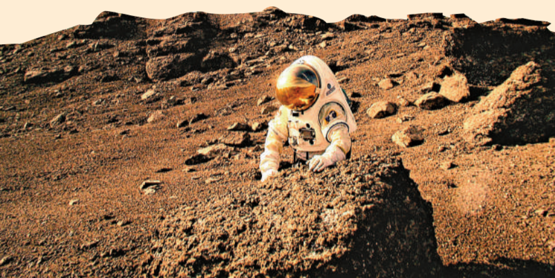
▲火星移民將要忍受無比孤獨

【本報訊】綜合媒體12日報道：早前有報道指，人類最快在20年後就可以展開火星單程之旅，報道刊登後，至今已超過400人爭相報名，表示願意充當首批有去無回的「火星移民」。前往火星的單程旅行至少要花上10個月時間，並且沒有「回程票」，等同將自己「永遠放逐出地球」，但這些爭相報名的志願者都聲稱已做好了「壯士一去不復返」的心理準備。