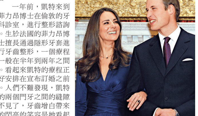
▲凱特被指曾進行牙齒整形

據報道，在威廉王子與未婚妻凱特·米德爾頓宣布結婚前，凱特曾到過法國籍整形醫師菲力昂博士在倫敦的診所，接受了牙齒增白化妝。實際上，準王妃接受的是一整套牙科療法，以確保她在鏡頭前露出最燦爛的笑容。