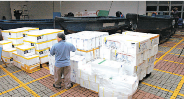
▲水警檢獲大批走私高檔海鮮，相信與臨近歲晚有關

部分更為猥褻程度嚴重的第四級物品。被告早前在區院承認一項管有兒童色情物品罪，昨日被法官判處監禁二十個月。法官判刑時斥責案中涉及的相片及片段的兒童飽受剝削，包括五歲以下嬰孩，內容令人側目且可恥可悲。他指出，有觀眾才會使兒童色情物品有市場，令不法者變本加厲，因此必須嚴懲管有者，由於被告認罪，判監兩年，並因被告行為良好減刑至監禁二十個月。