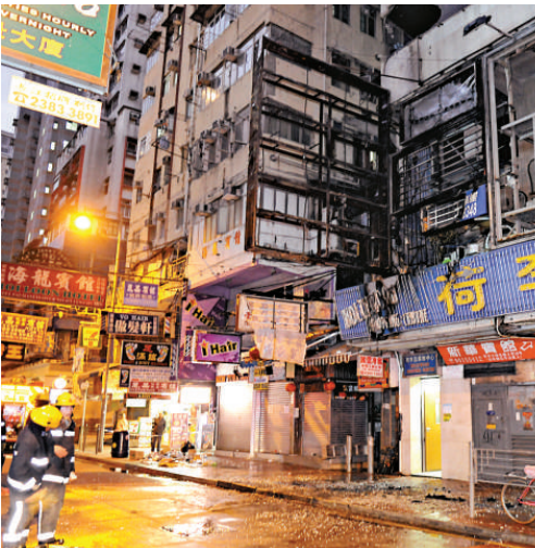
▲巨型招牌着火波及一間寵物店外牆玻璃窗爆破，碎片撒滿一地