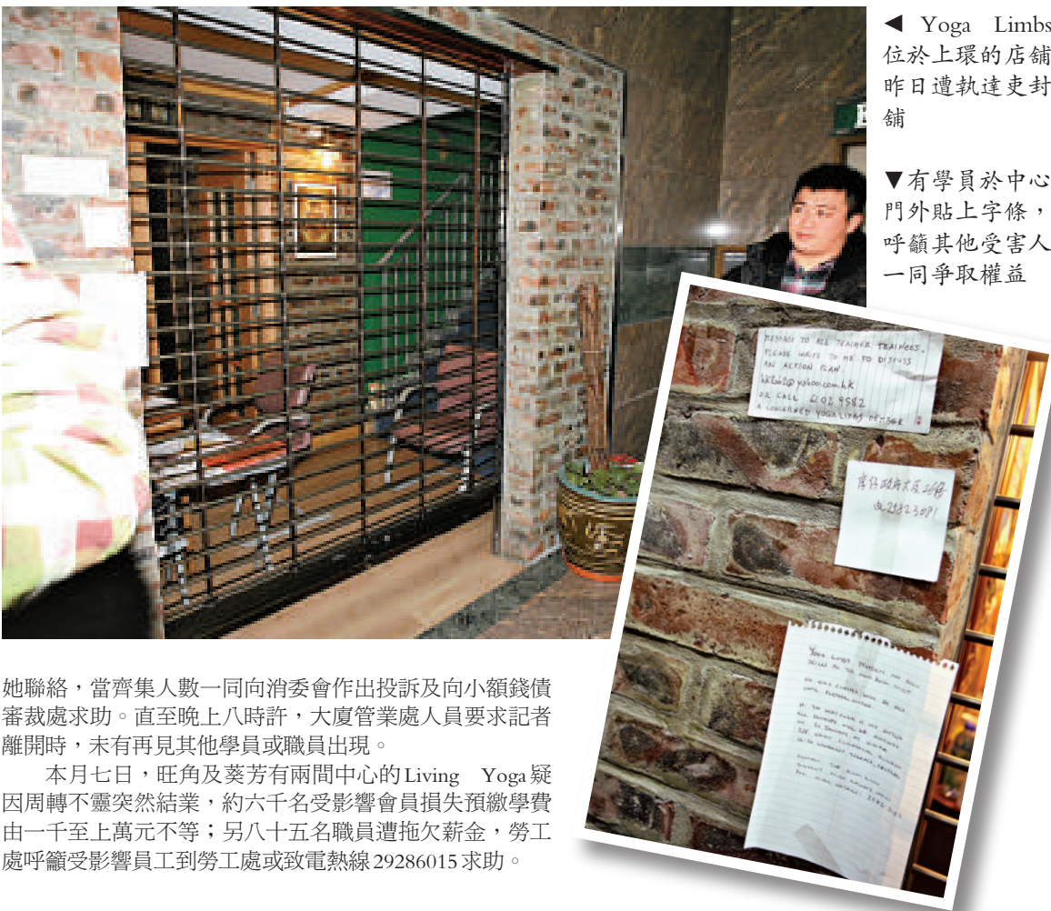
◀ Yoga Limbs位於上環的店舖昨日遭執達吏封舖

記者守候期間，有數名不知情的外籍男女會員到達中心準備上瑜加課，當他們在得悉中心已經結業後，深表驚訝。其中一名英籍女學員向記者表示，她在去年九月報讀學費兩萬多元的瑜伽教練課程，計劃在取得證書畢業後返回英國從事瑜加教練工作。詎料中心突然結業，課程僅完成一半，既未能追回學費，又未能取得證書，不知怎算好。她離開前在中心門外貼上告示，呼籲受影響學員盡快與