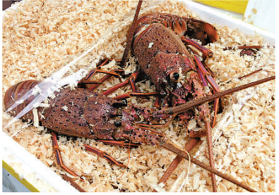
◀走私海鮮包括龍蝦、蠔及象拔蚌等