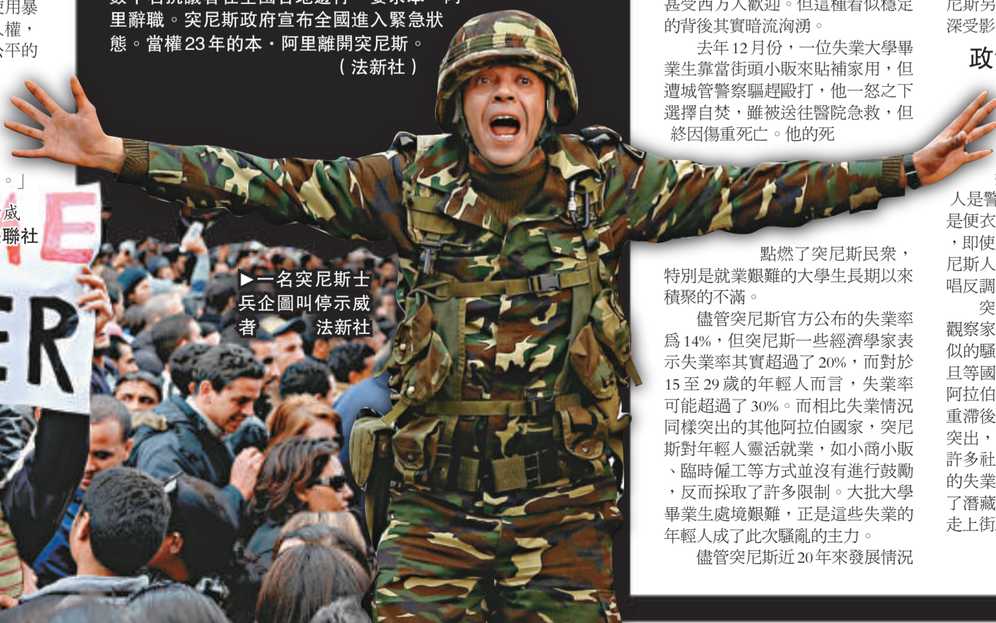
▶一名突尼斯士兵企圖叫停示威者。

察打人投訴，憤怒之下，這位青年縱火自焚，以示抗議，結果引發了突尼斯全國各地持續3周的大規模社會騷亂和流血衝突。特別是最近幾天，突尼斯社會局勢急劇惡化，首都所在的大突尼斯地區也開始出現不同規模的群眾性示威集會和遊行。抗議貧窮、失業，反對腐敗是突尼斯此次爆發騷亂和迅速蔓延的主要原因並引起了大多數民眾的共鳴。