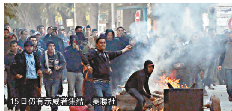
15日仍有示威者集結。

上述的被封鎖電文由美國駐突尼斯大使戈代克撰寫。他寫道：「內部圈子的貪污越來越嚴重。連突尼斯的平民都強烈關注這個問題，控訴之聲越來越大。突尼斯人十分討厭第一夫人萊拉和她的家人，甚至憎恨他們。反對派私下嘲笑她。」文中分開多節描述本·阿里家族的運作方式，每節有個小標題，包括「上層在天上」、「一切盡在家族裡」、「要找一艘遊艇」、「給我看看你的錢」等。