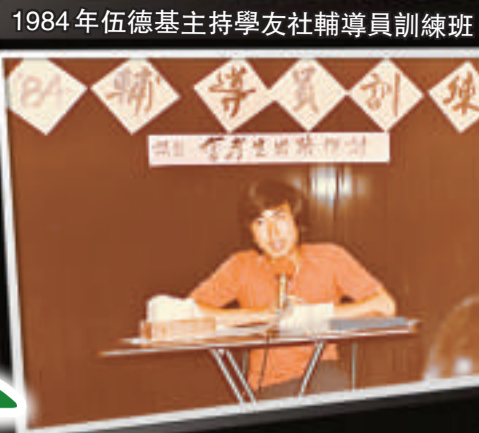
1984年伍德基主持學友社輔導員訓練班