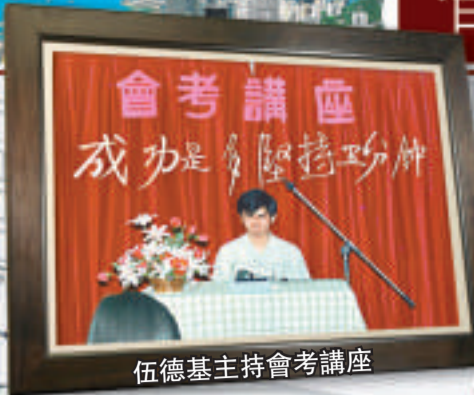
伍德基主持會考講座