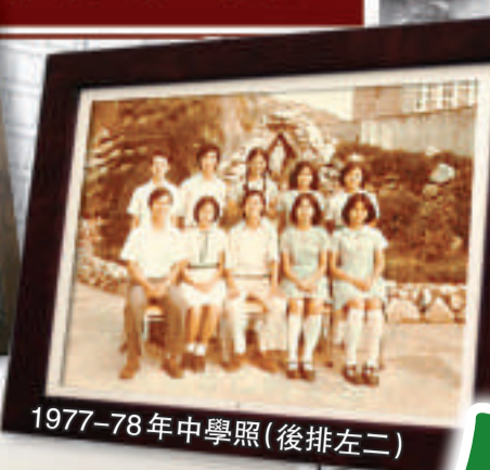
1977-78年中學照(後排左二)