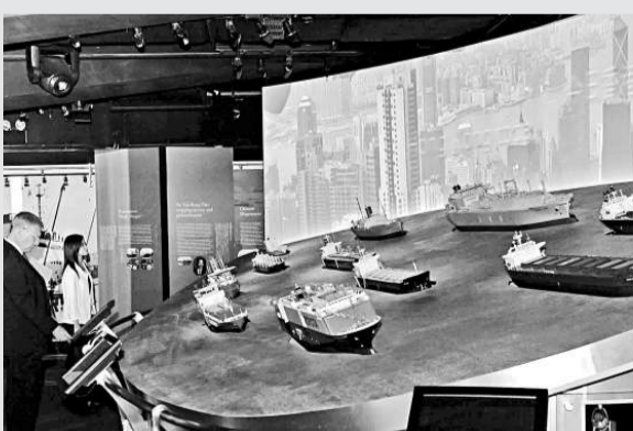
位於赤柱美利樓的海事博物館即將遷往中環8號碼頭

【本報訊】立法會工務小組委員會昨日討論香港海事博物館的搬遷及擴展工程。有議員擔心，博物館的公共空間管理權責不清，將來或會引起使用的爭論。政府表示，會在租約列明館內不同地方的權責分配。