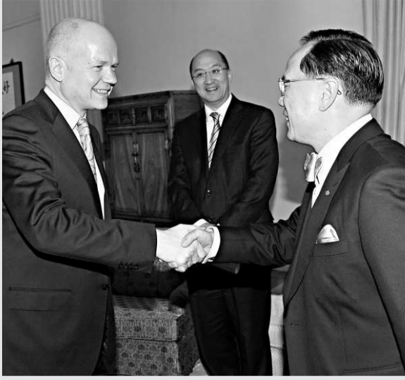
英外交大臣訪港 行政長官曾蔭權昨日下午在禮賓府會見訪港的英國外交及聯邦事務大臣夏偉明(左)。