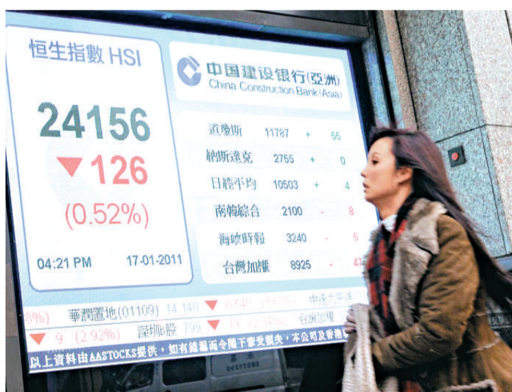
▲港股先升後跌，受A股拖累，恒指低收126點

內地投資氣氛轉淡，拖累港股回軟，其中中資金融股、內房股沽壓較大，幸得長和系及本地地產股逆市走好，抵銷內地股市的負面影響，令到恒指全日僅跌126點，收市成交縮至709億元。