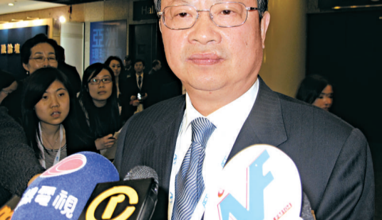
▲中移動董事長王建宙表示，預期今年3G用戶增長將更快